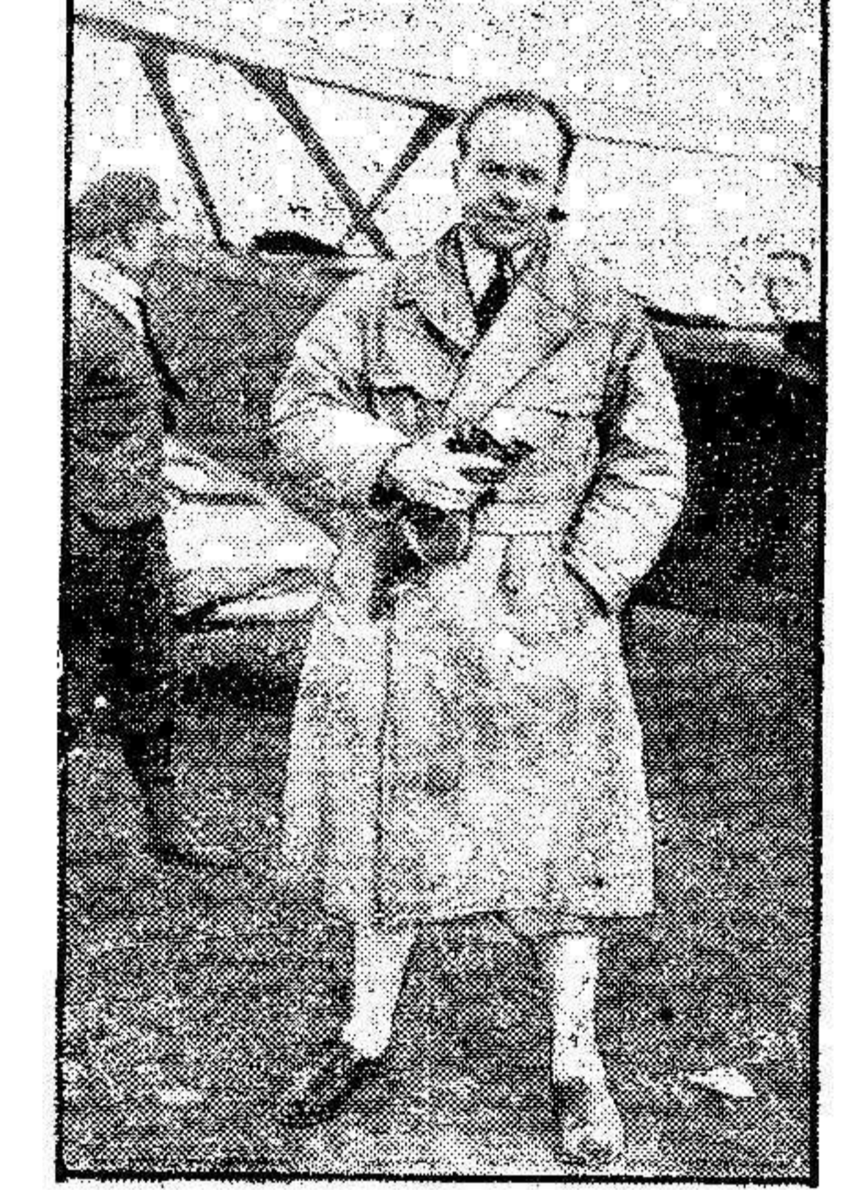
El conocido aviador alemán, que se hizo célebre impresionando la película «Una tempestad sobre el Mont-Blanc», se ha expuesto a una nueva aventura, bastante desagradable, viéndose obligado a aterrizar en las peligrosas márgenes del Nilo.