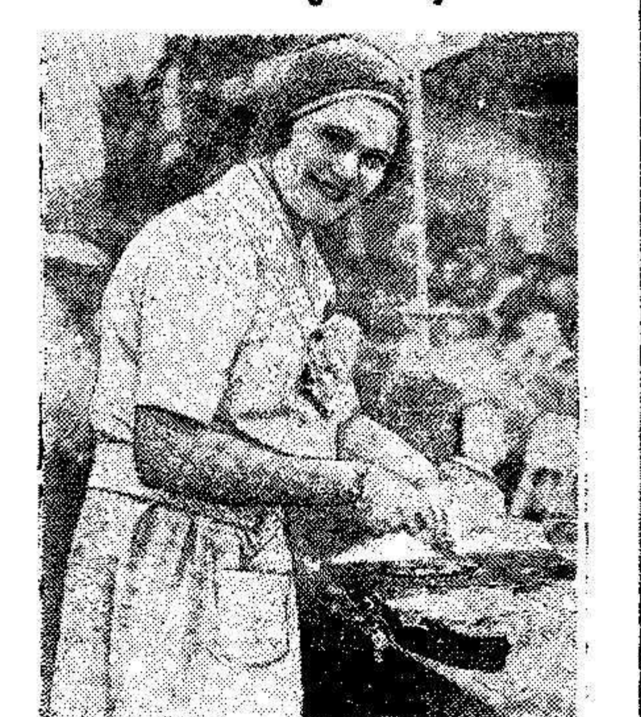
En la exposición de arte culinario que actualmente se celebra en Berlín, sus organizadores han concebido la idea de efectuar una competición de cocina, en la que tomarán parte las vedettes del cinematógrafo y del teatro.