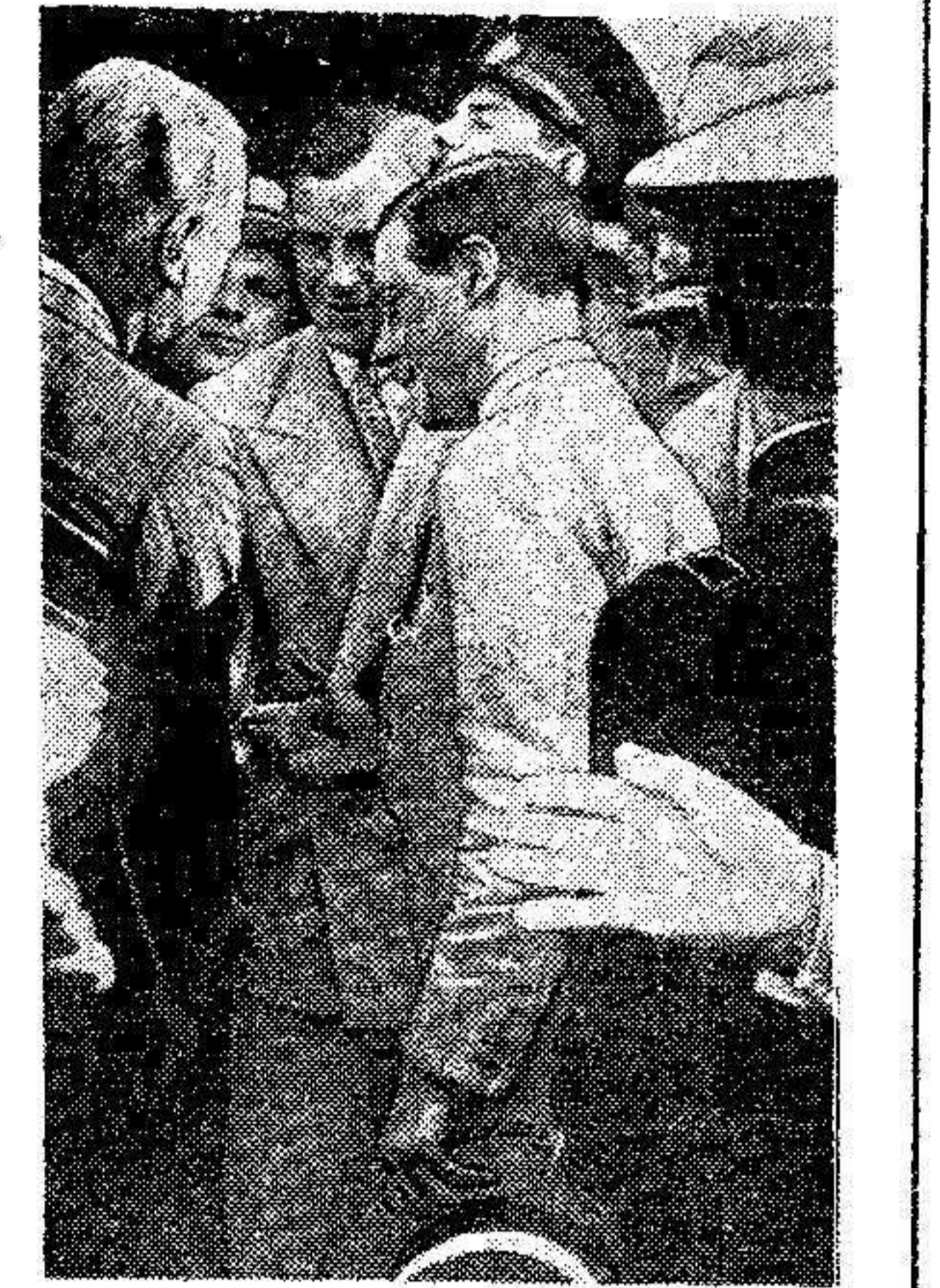
En nuestra fotografía aparece el Príncipe de Gales, heredero del Trono de Inglaterra, acompañado de su hermano el Príncipe Jorge...