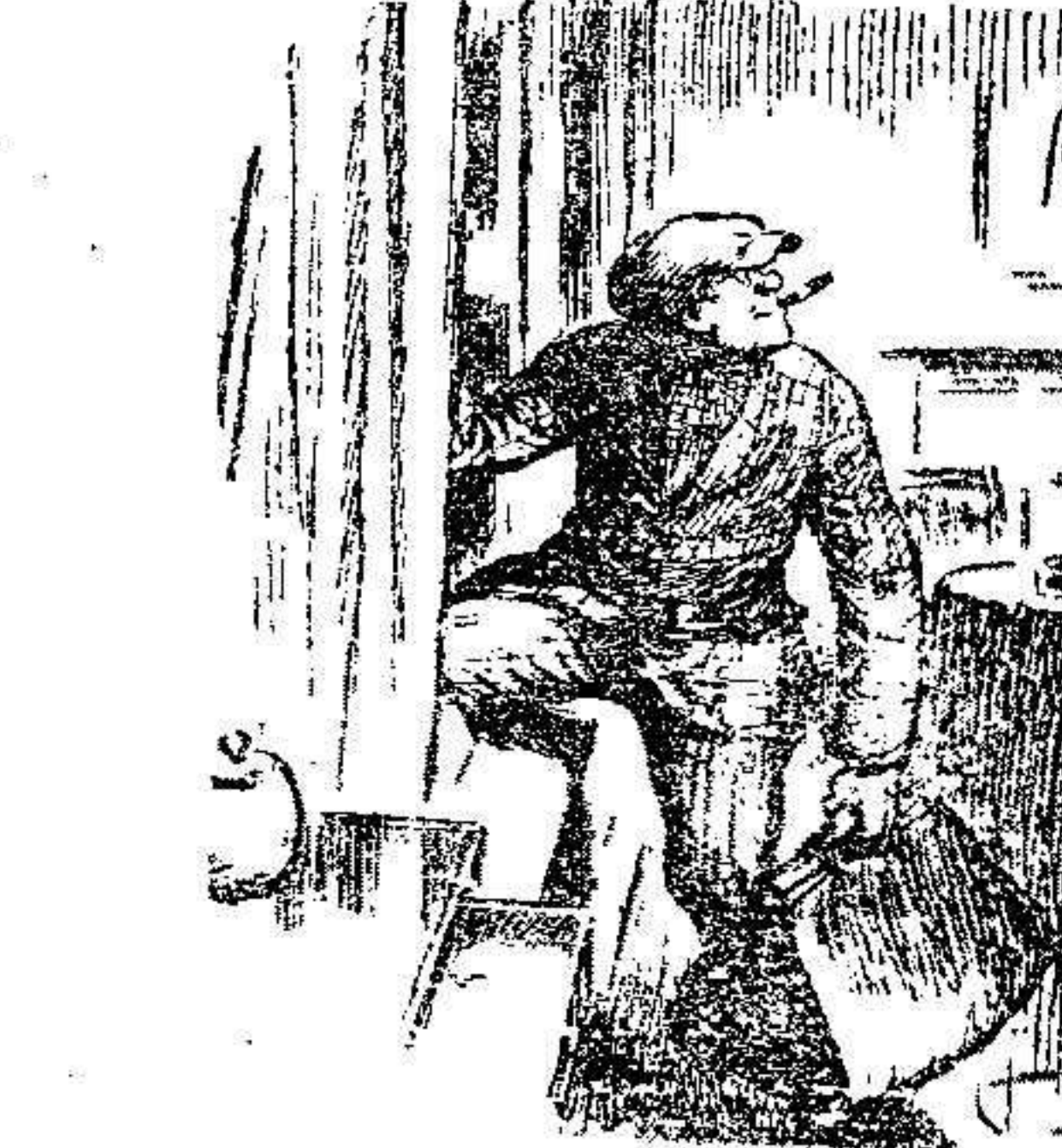
CLIENTES CARITATIVOS —No salte usted por la ventana, hombre, que se puede lastimar. —Muchas gracias, caballero, pero con este bolín, ya puede uno cumplir con el doctor...