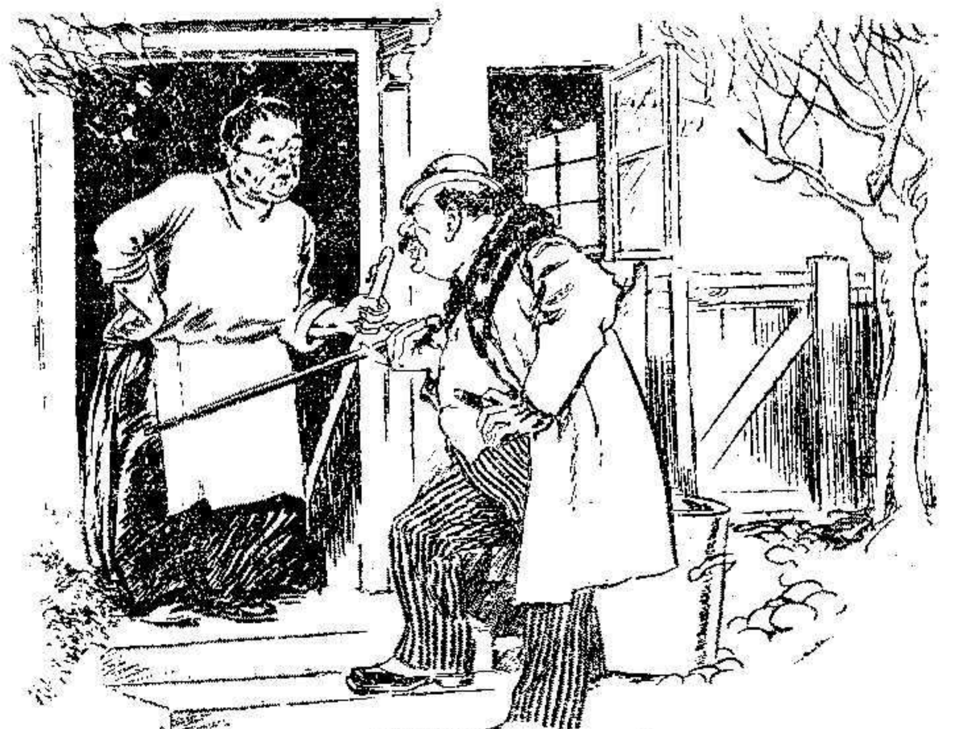
LAS RENTAS AJENAS