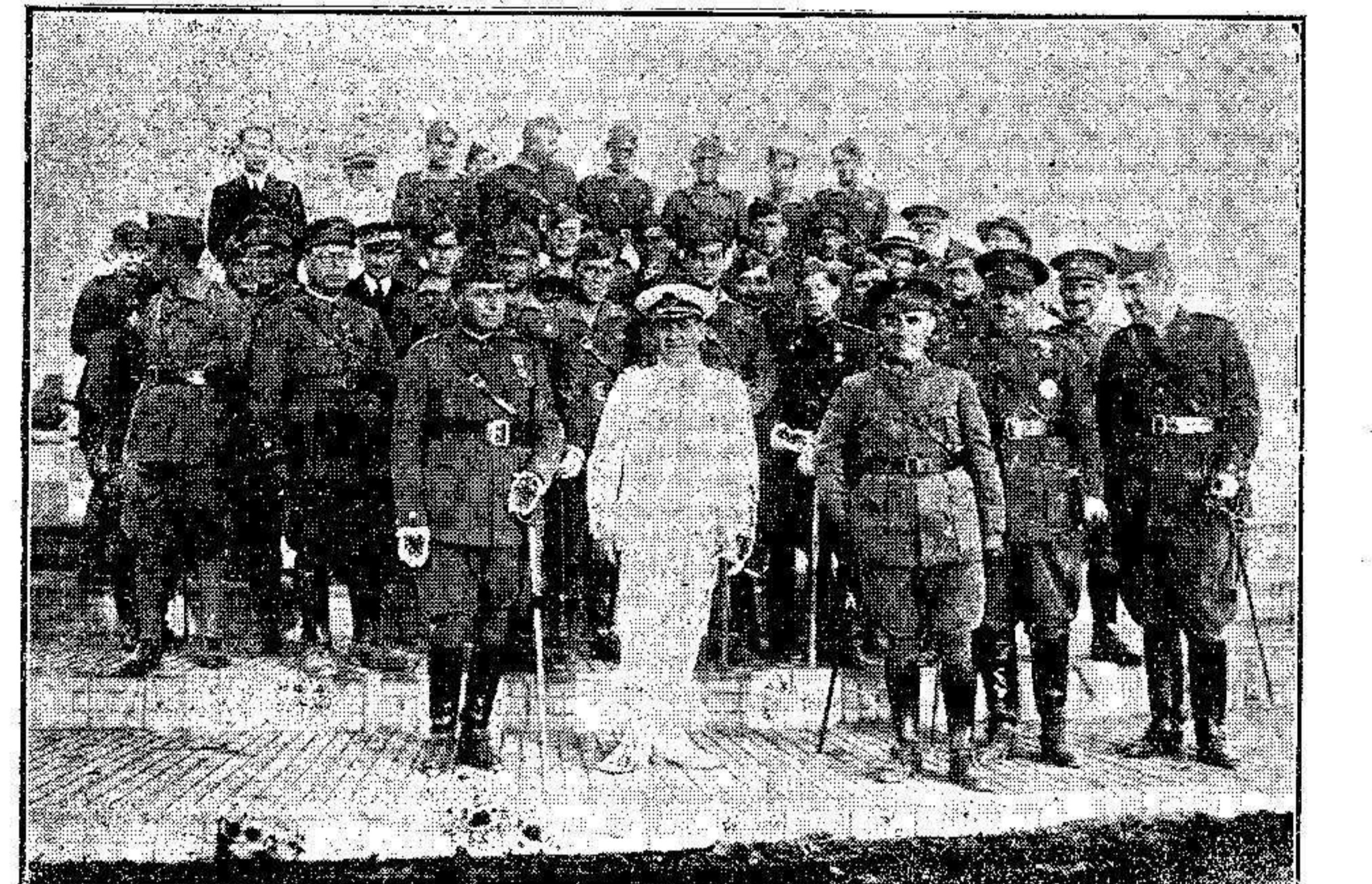
El Alto Comisario conde de Jordana, con el general Pozas, rodeado de un grupo de oficiales del Tercio, durante la visita al campamento de legionarios de Taúma.