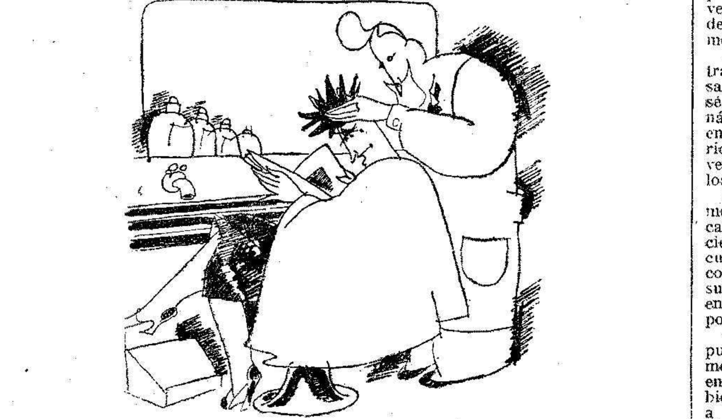
EL CORTE DE PELO A LO VENECIANO

No sé cómo se harán estas cosas en las grandes capitales, pero en las modestas de provincias, sale un periódico por vez primera a la calle: "El Clamor", "La Pelea", "La Escoba", y se lo entrará a uno por debajo de la puerta de su casa, una, dos, tres, diez veces y luego sin consultar la voluntad del supuesto suscriptor, "zas", a fin de mes, el recibio.