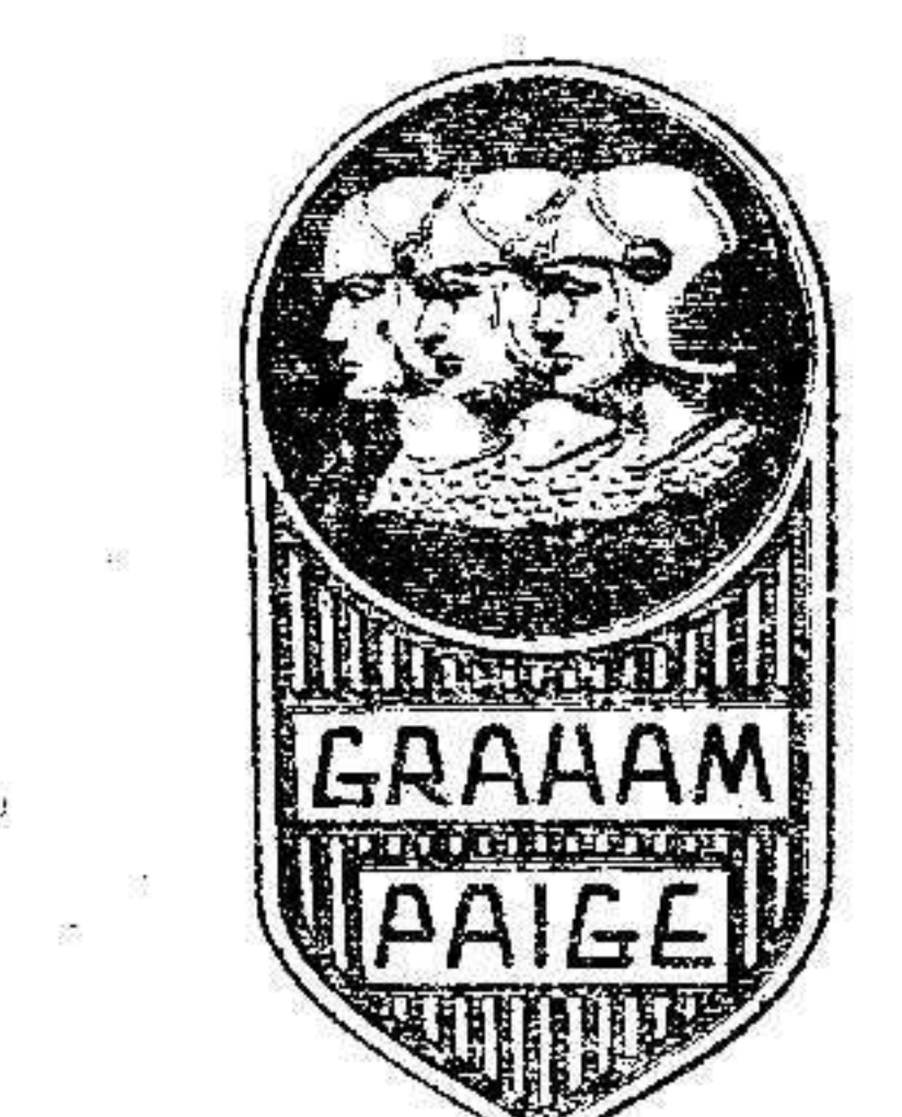
Estos nuevos modelos Graham-Paige para 1929, ofrecen una gran variedad de carrocerías, incluyendo Roadsters, Cabriolets, Coupés y Sport Phaetons, sobre cinco chassis distintos, de seis y ocho cilindros, a precios al alcance de todos.