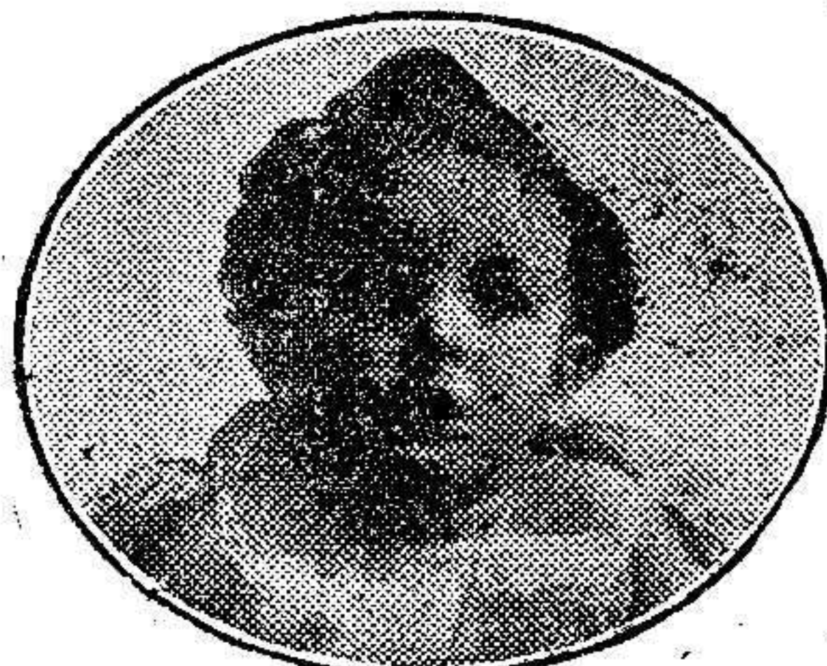
Yo soy el pequeño Mañé criado con la leche condensada P.F. ESBENSEN

Crie a su hijo con leche P. F. ESBENSEN y será fuerte y robusto