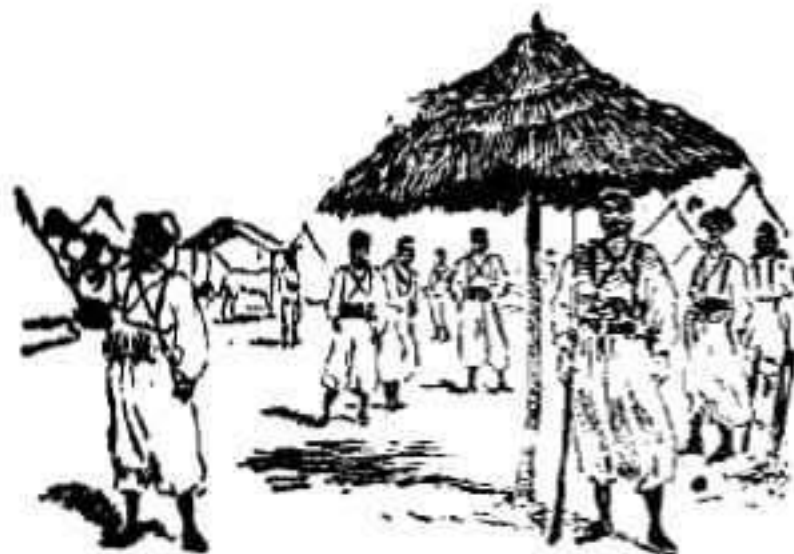
Campamento de una columna volante.

جمع القبائل تغافل الفرنسيين وخرج اليهم الفرنسيين في عدد كبير من الجيوش بقبائل معهم وطلبهم بعد ان مات ما اتقان وجرحت منه مسجارج واما الهياطين بلا نظن الا انهم كان منهم عدد حيث انكسرو وقد علم ضرورة ان المسلمين لا تكون هواطهم ابدا الا بعد القتال الشديد مع الفرنسيين على اولم يغزو