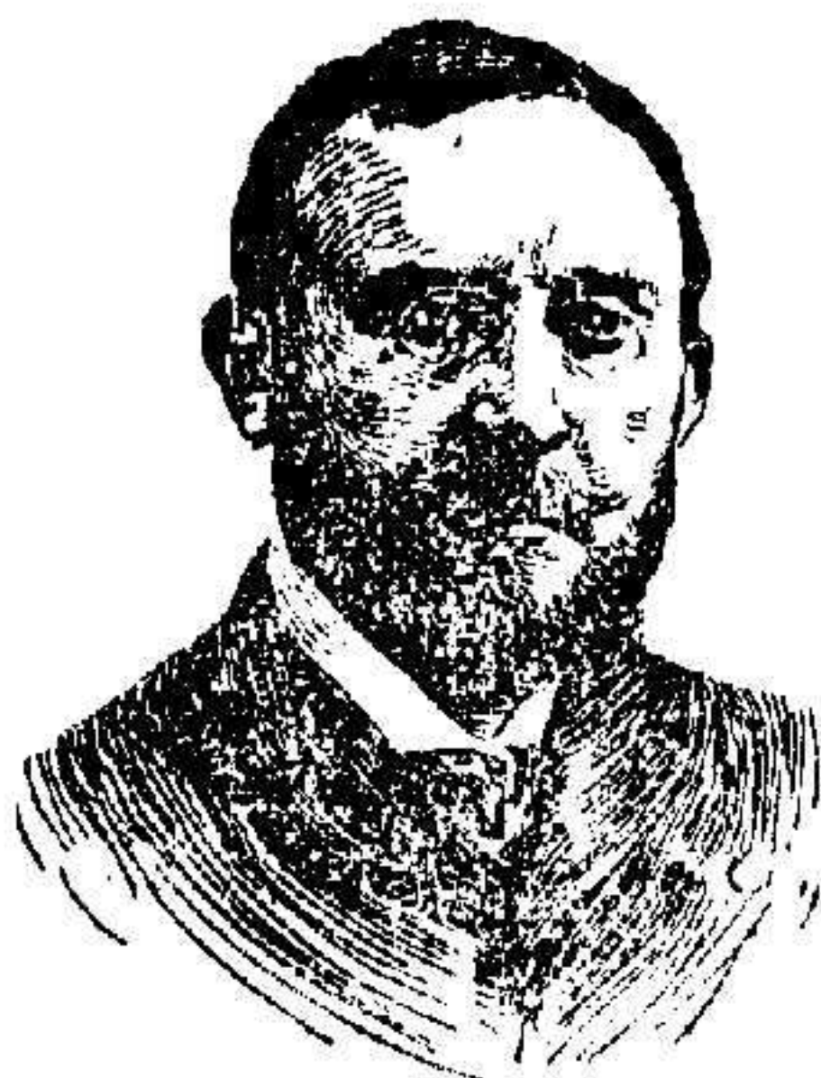
SR. MARQUÉS DE FIGUEROA, Ministro de Gracia y Justicia.

En el gran salón de actos del Palacio de Justicia, con la solemnidad de costumbre, se ha verificado la ceremonia de apertura de Tribunales, el día 16, por ser festivo el 15, día señalado por la ley.