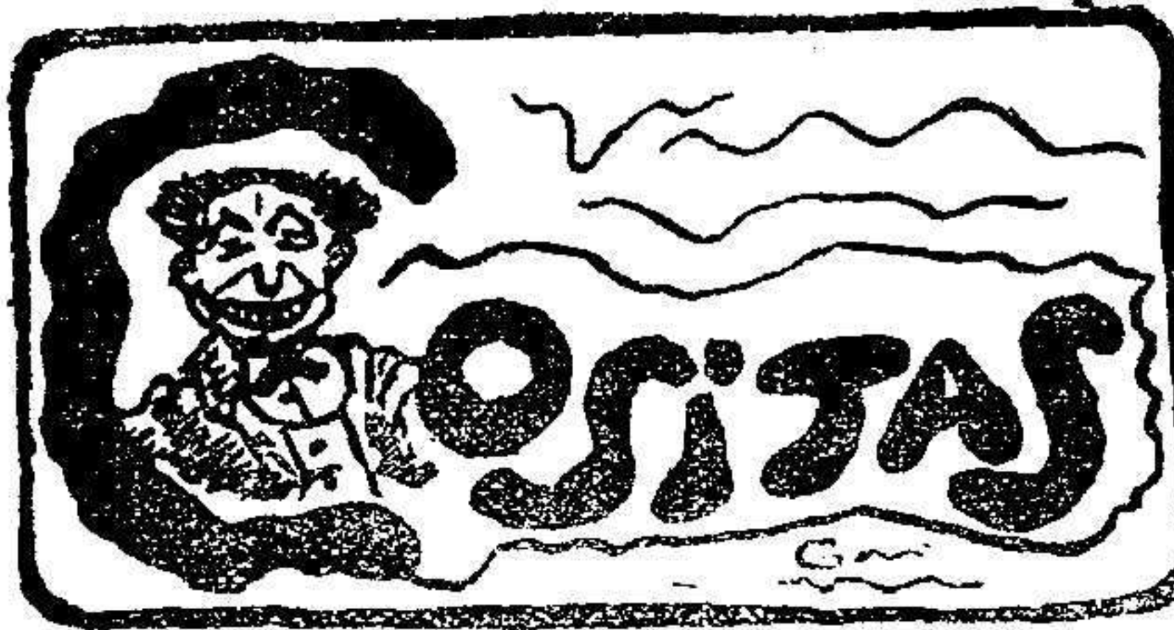
Las travesuras de Don Jaime

Garganta, voz y boca, se curan con las pastillas del Dr. Caldeiro. En farmacias, caja 1'50 pesetas; por 2 las remite el autor, Puerta del Sol, 7, Madrid.