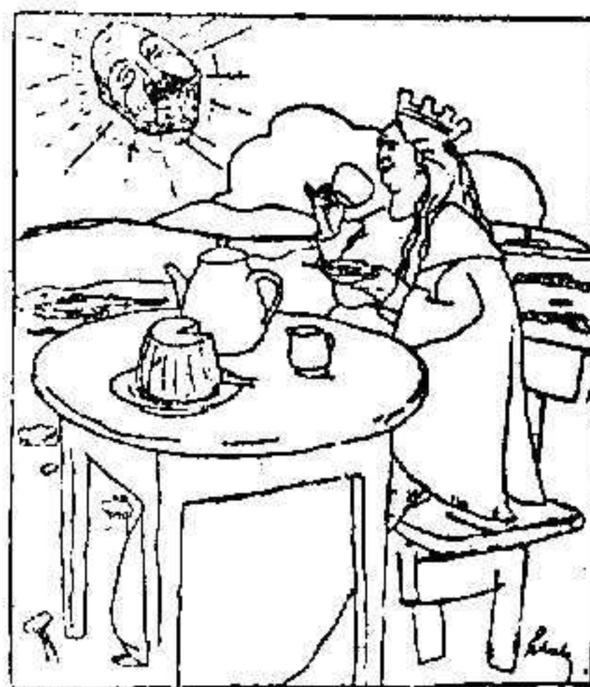
El sol de Primavera beneficia con sus rayos á la convaleciente España. (Del Matino.)