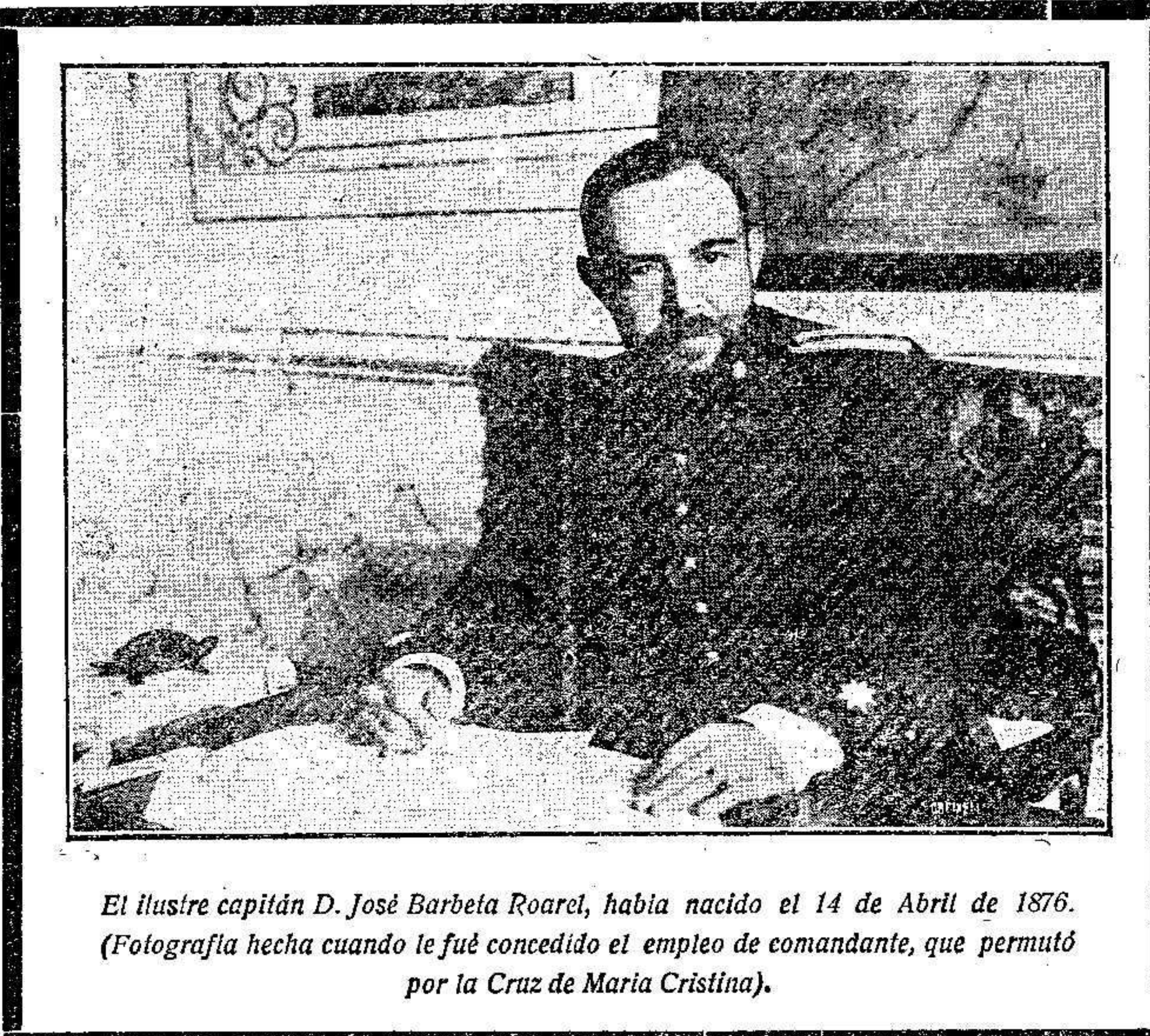
El ilustre capitán D. José Barbeta Roarel, había nacido el 14 de Abril de 1876. (Fotografía hecha cuando le fué concedido el empleo de comandante, que permutó por la Cruz de María Cristina).

Quien así trabajó en pro de los intereses de España en el Rif es acreedor al homenaje que le tributamos y á que el Estado vele por el porvenir de la viuda y de sus infortunados hijos.