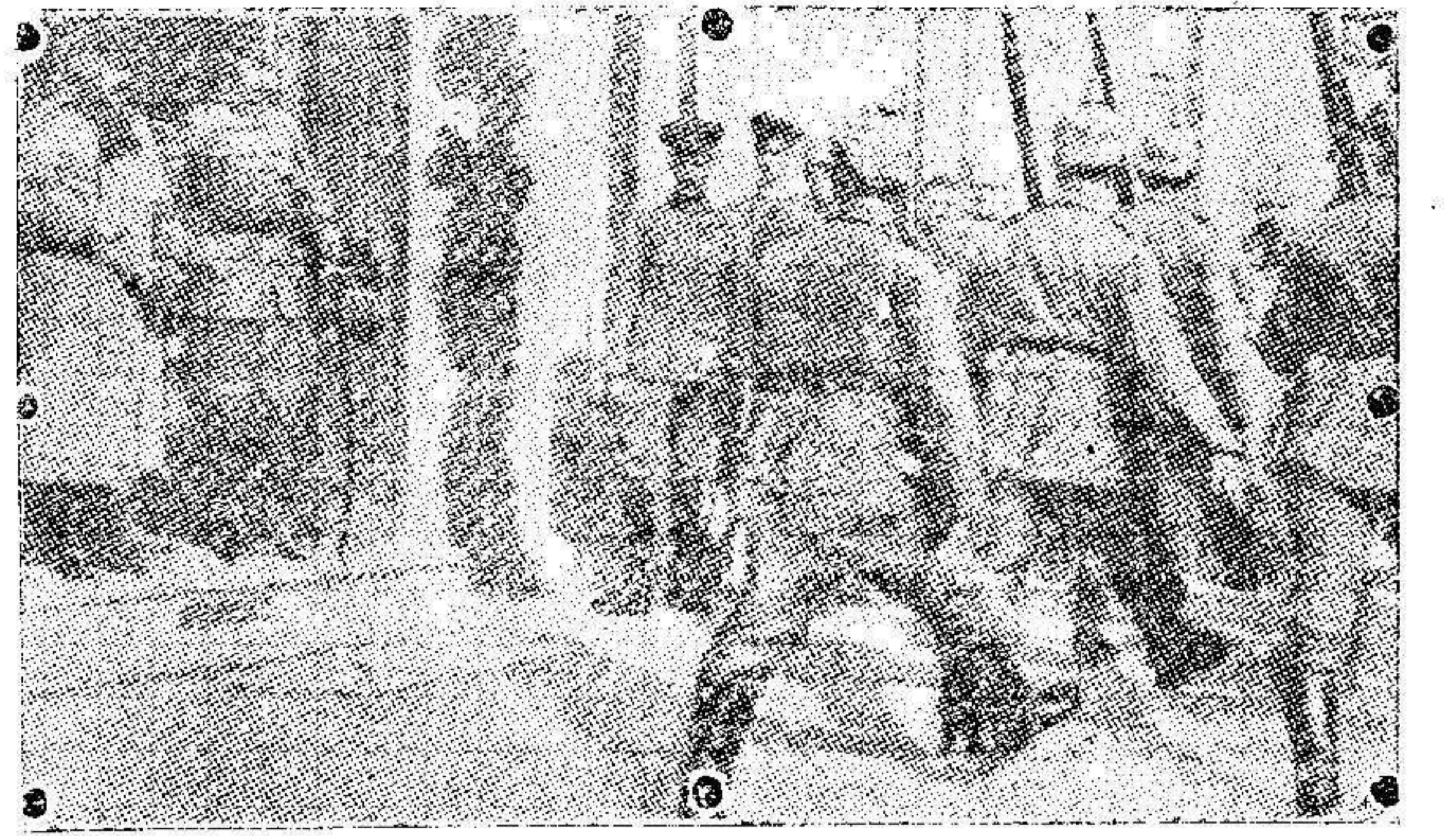
Una revista de fuerzas alemanas, en la cual desfilaron ante el Kaiser y el Príncipe imperial los soldados, ordenada por el Emperador para contener los rumores relativos a la muerte de su hijo.

Academia Mercantil 49 Clases prácticas de contabilidad. Preparaciones de carreras civiles. O'Donnell B. Para detalles al Sr. Interventor del Banco de España.