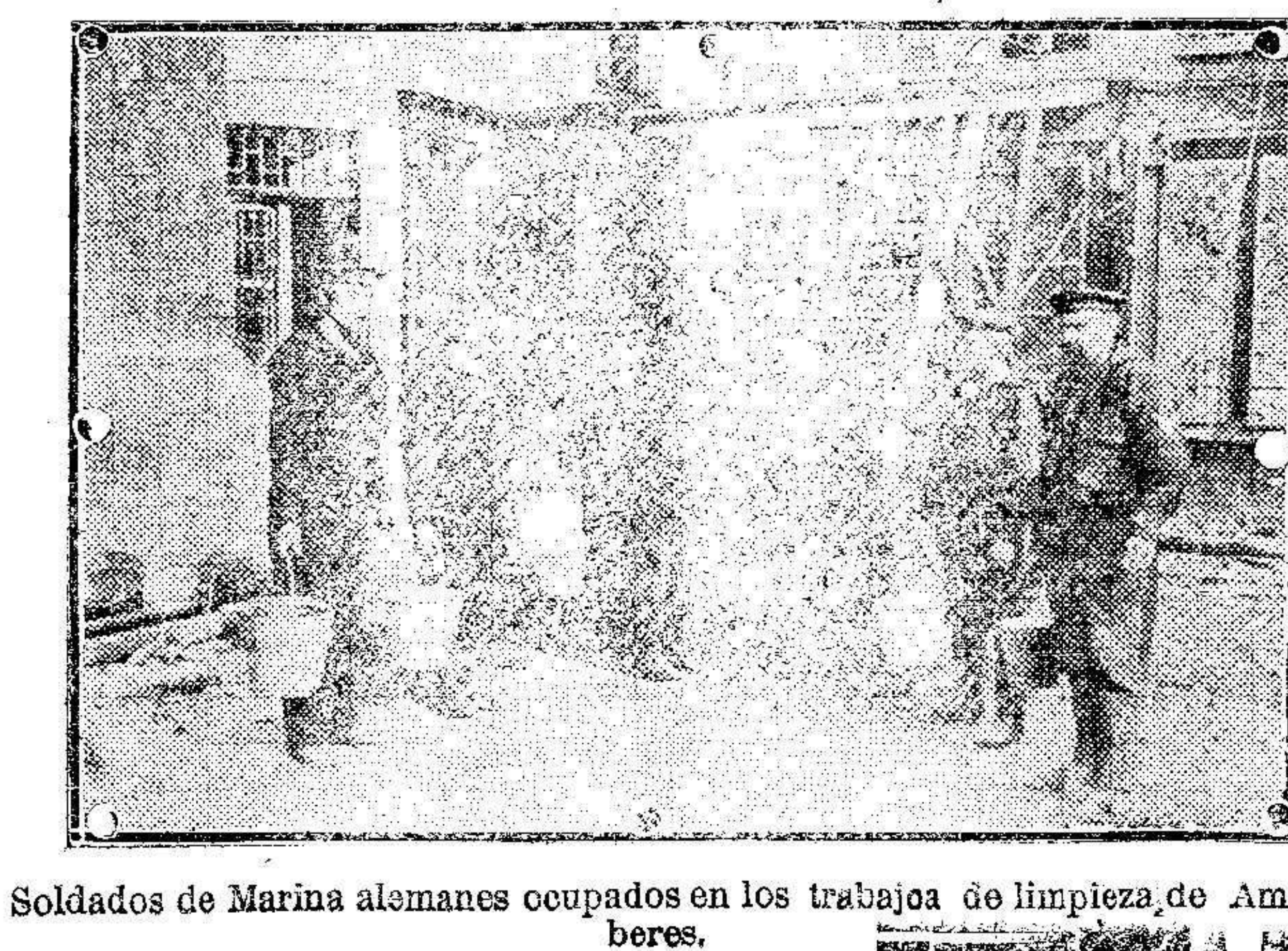
Soldados de Marina alemanes ocupados en los trabajos de limpieza de Amberes.