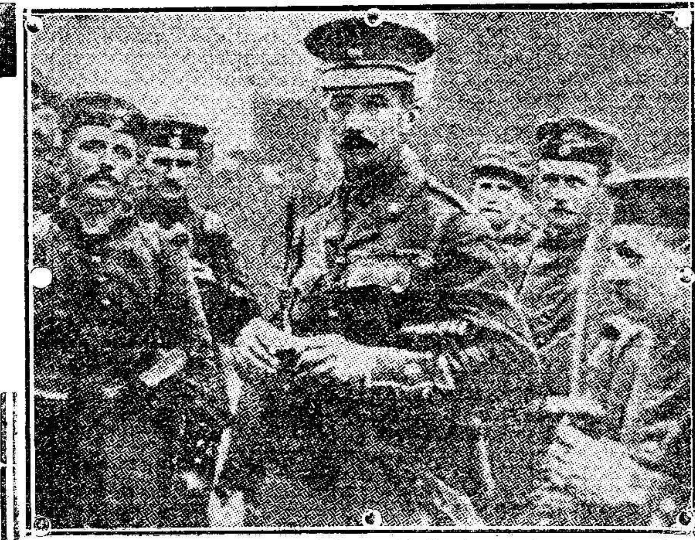
Oficial inglés prisionero de los alemanes.

Un barbudo capitán que há pocos días regresó del Testadín, decía con cara de satisfacción: