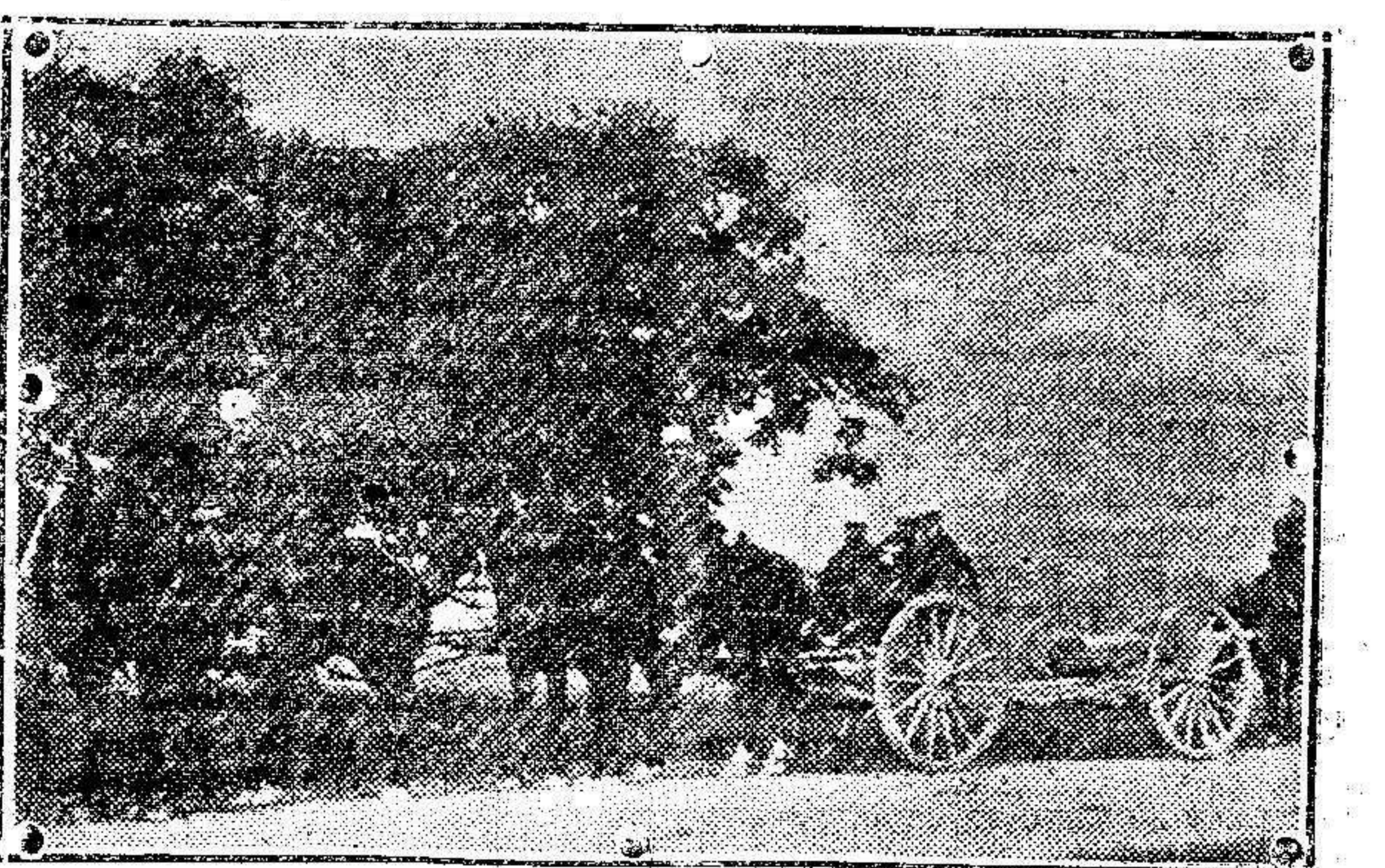
Batería de artillería francesa encaminándose á una posición.

Poco antes de mediodía regresaron á sus respectivos campamentos, las columnas volantes de Setun y Monte Arrui, que se movilizaron para proteger este mercado.