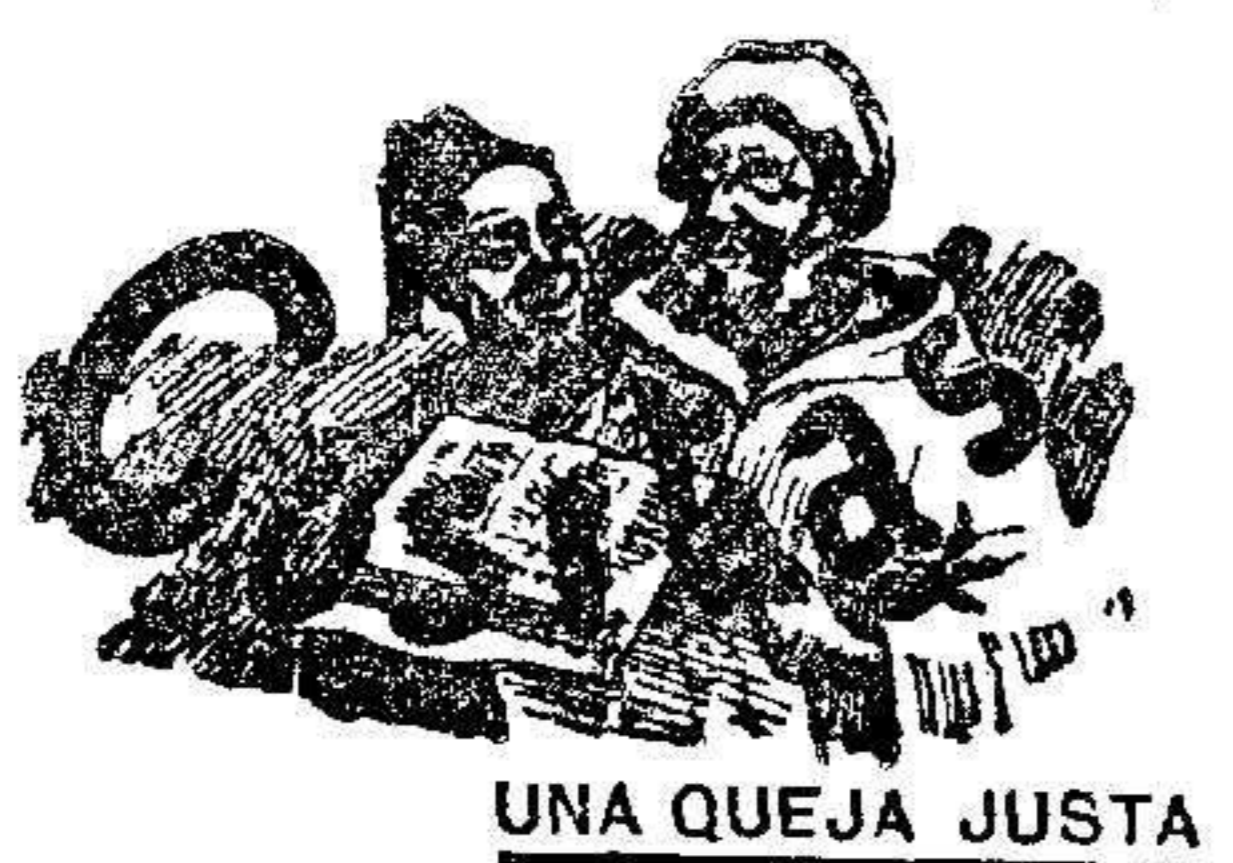
UNA QUEJA JUSTA