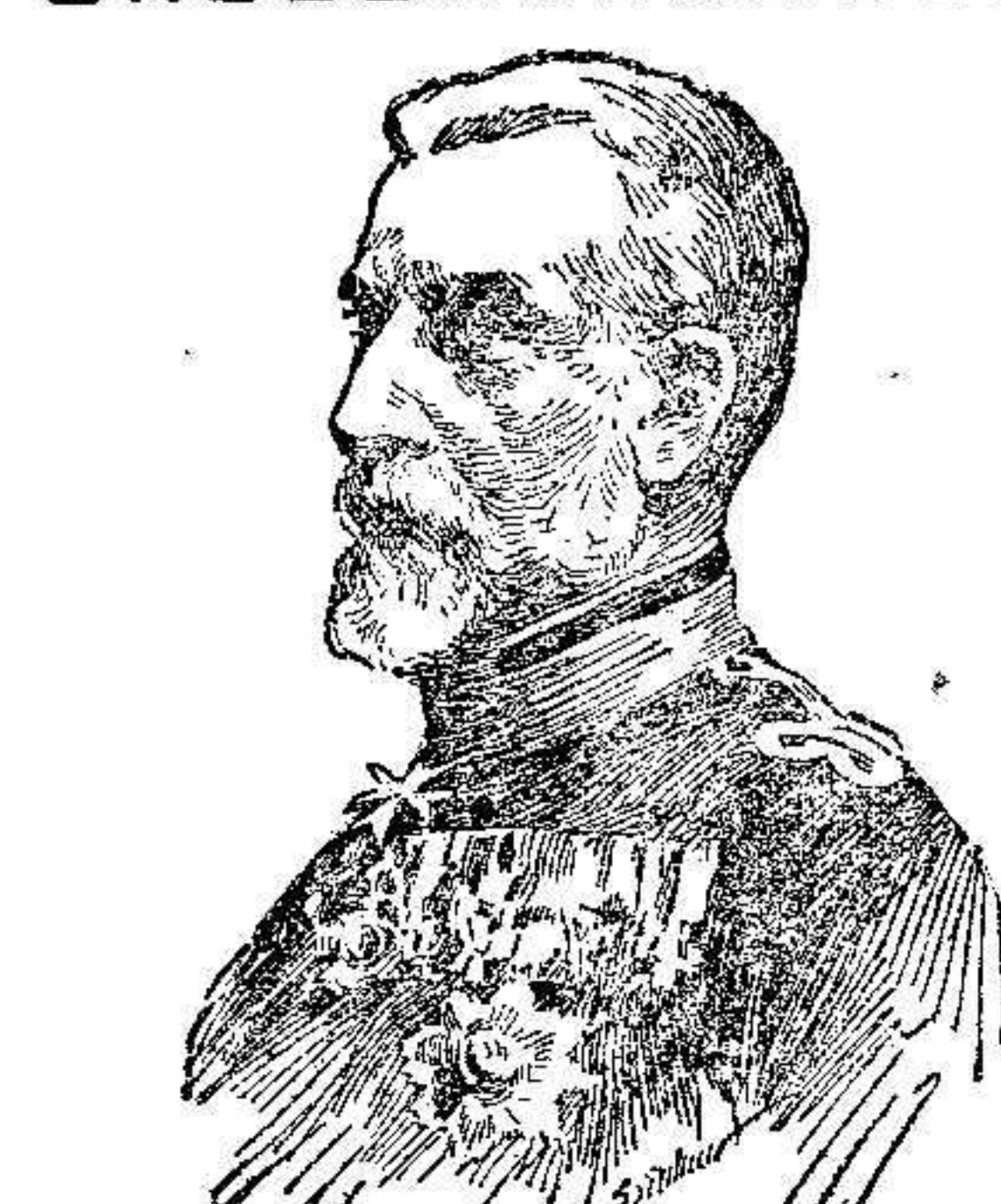
Carlos I de Rumania, fallecido el domingo último.

El periódico de Viena, "Wiener Arbeiter-Zeitung", hace el siguiente extracto: "Los cinco cuerpos de Ejército ruso del Norte, que se arrojaron en Transilvania, Prusia y parte del de Varsovia. Uno ó dos Cuerpos de Ejército del Norte se habían adelantado contra Insterburg y Gumbinnen, donde sufrieron igual derrota. En total, estaban reunidos contra Alemania diez Cuerpos de Ejército; otros veinte Cuerpos de Ejército están, según los datos del Estado Mayor austriaco, en el Sur de Polonia. Estos treinta Cuerpos de Ejército forman el Ejército ruso de primera línea, el que tiene en Europa á la disposición de las zonas militares europeas, San Petersburgo, Viena, Varsovia, Kiev, Odesa, Moscú, etc. Otros diez Cuerpos de Ejército están en el Cáucaso, Turquía y Siberia. De los veinte Cuerpos de Ejército que luchan contra Austria, más de diez han sufrido pérdidas en el combate y los Ejércitos de Danzi y Aulfe,berg, dos Cuerpos han perdido completamente toda su artillería. Por lo menos 120.000 rusos se encuentran en Austria y en Alemania prisioneros. Admitiendo que Rusia pueda transportar al teatro de la guerra de Europa una parte de las fuerzas de Turquía y de la Siberia, se necesitaría mucho tiempo para que esto pueda realizarse. Las amistades constantes en el Cáucaso tendrían que retener, por este motivo, una parte de los tres Cuerpos de Ejército del Cáucaso.