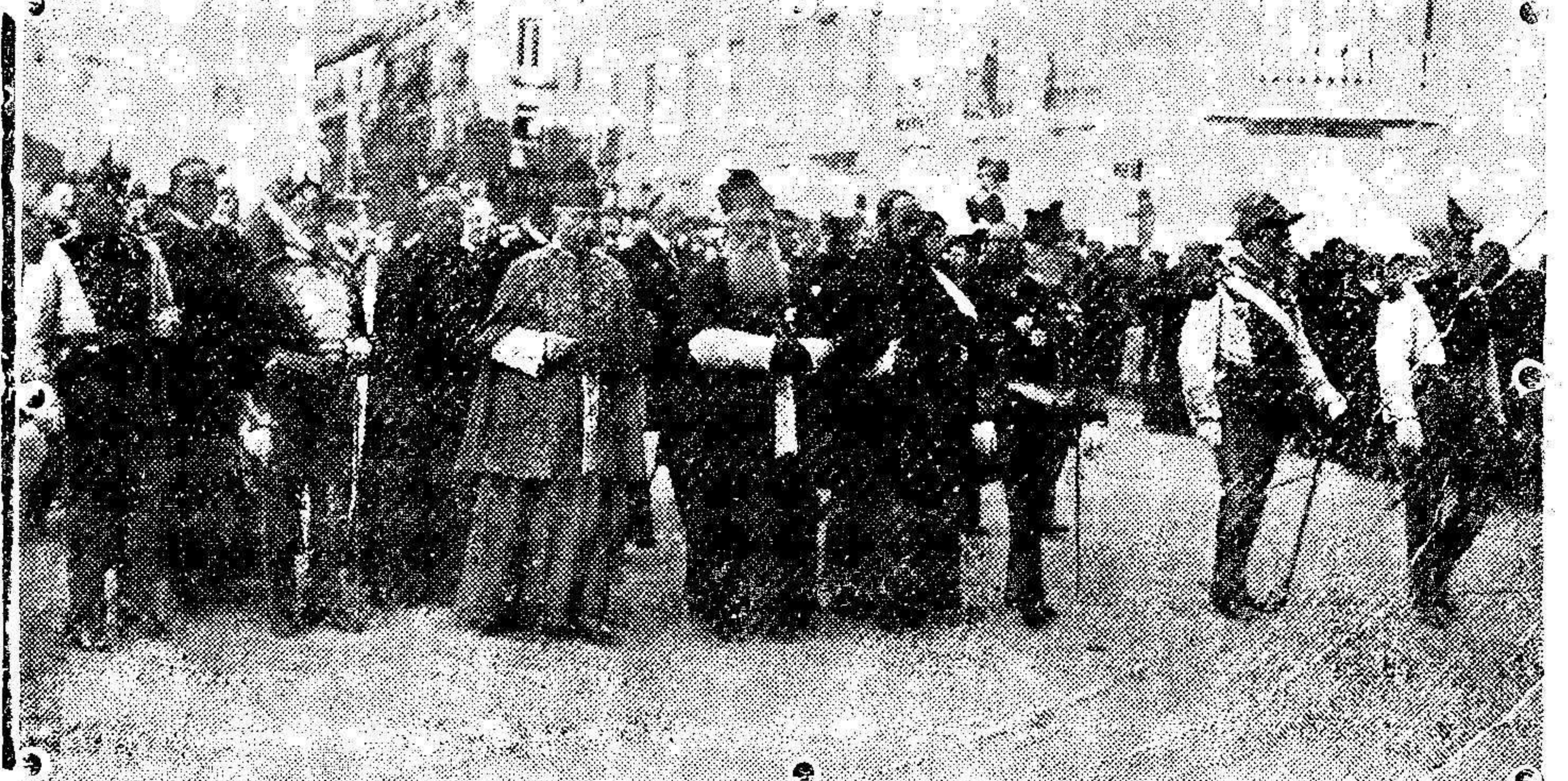
La procesión de terciarios que se formó en la Iglesia de Santa Cruz, de Madrid, para ir a la de San Francisco el Grande, donde se celebró la sesión de clausura del Congreso reunido por dicha Hermandad.

Para la península, donde pasará breves días, marchó ayer tarde el Teniente Coronel del Regimiento de Artillería de Monta-