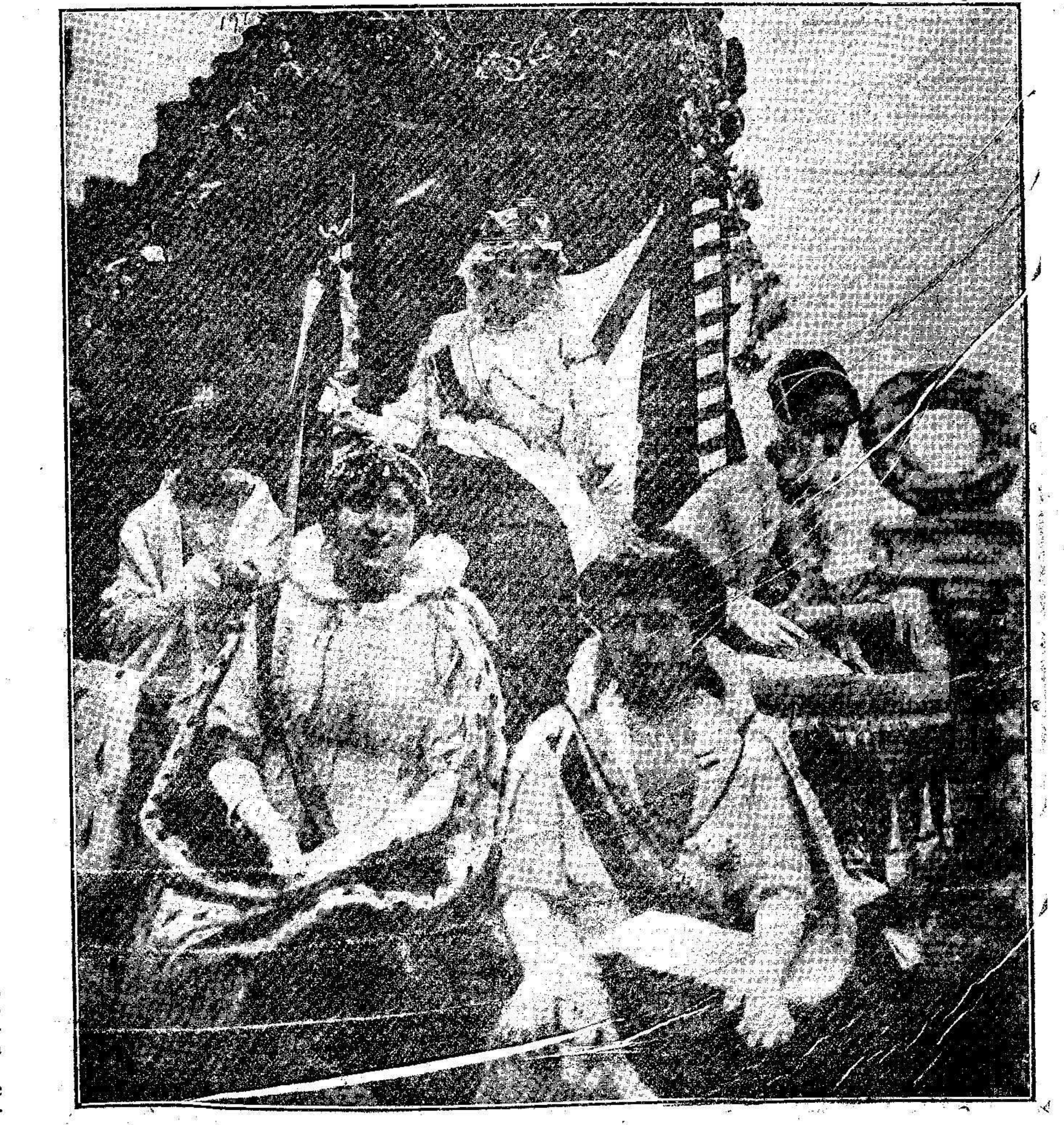
La fiesta de la Mi-Careme en París. La reina de la fiesta en su carroza, acompañada de la soberana de Turín y de sus damas de honor.

«El Excmo. Sr. Ministro de la Guerra, en telegrama de 28 del actual, recuerda la obligación ineludible en que se encuentran todos los señores Jefes, Oficiales é individuos de tropa de tomar la venia de la Autoridad superior del territorio en que sirvan para poder publicar con su firma escritos en la prensa.»