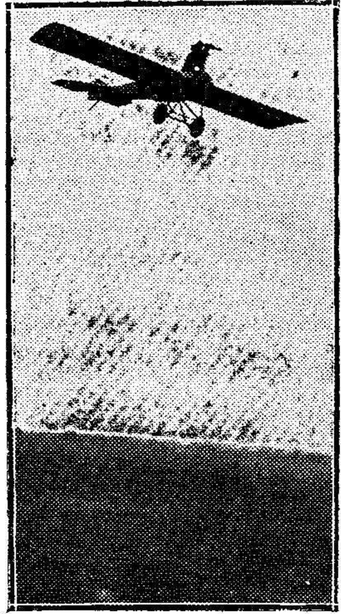
EN FRANCIA.—El primer aeroplano ametralladora en pleno vuelo.

Las malas cosechas de los años anteriores determinan que el tráfico no sea todo lo intenso que fuera de desear; pero, sin embargo, la recaudación aduanera se ofrece muy halagüeña y en lo porvenir se acrecentará, pudiendo considerarse como una de las fuentes de ingreso más saneadas que habrán de aminorar los sacrificios actuales del erario español para el desarrollo de nuestra actividad y de nuestra acción en los territorios rifeños.