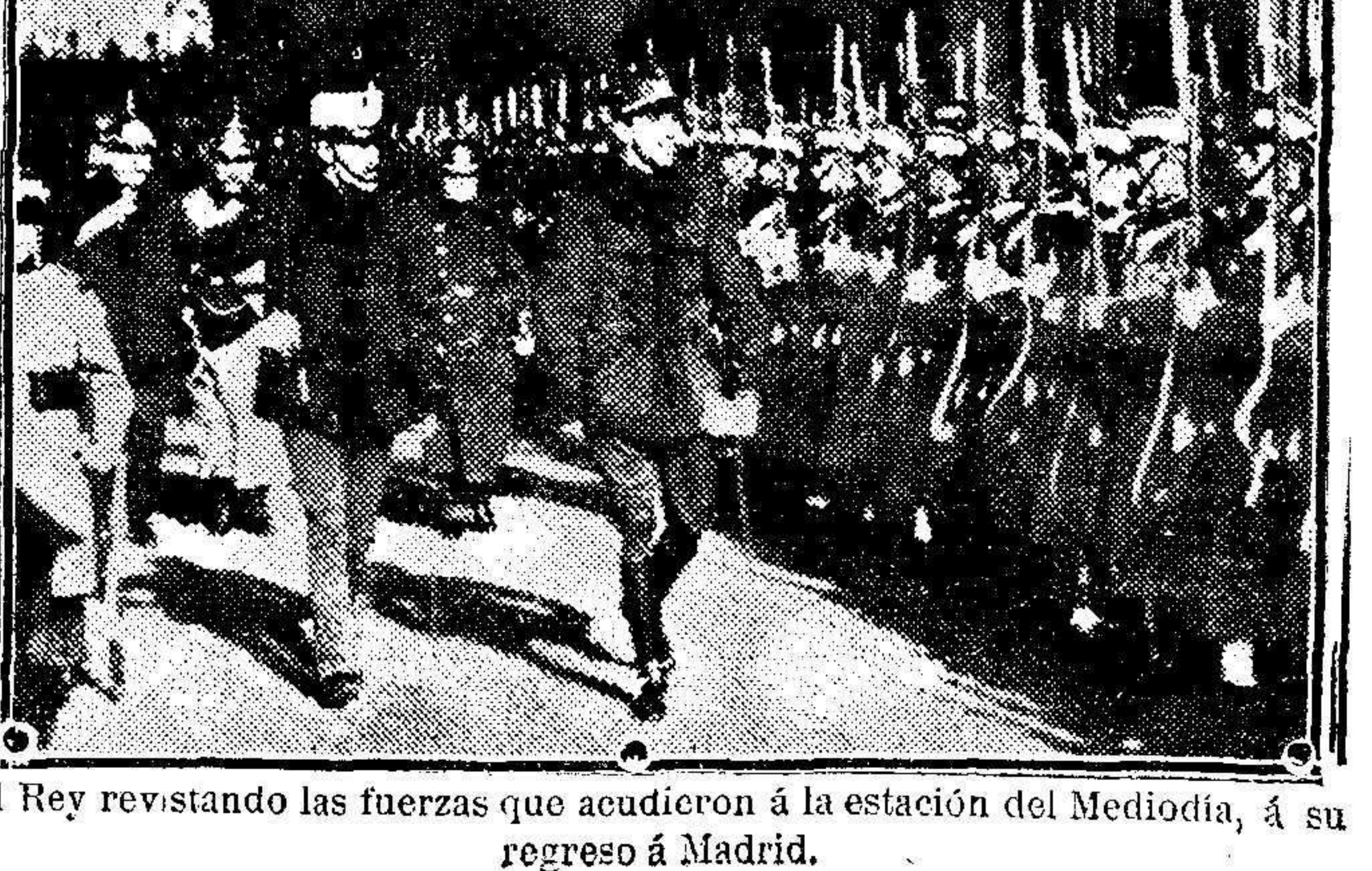
El Rey revistando las fuerzas que acudieron á la estación del Mediodía, á su regreso á Madrid.