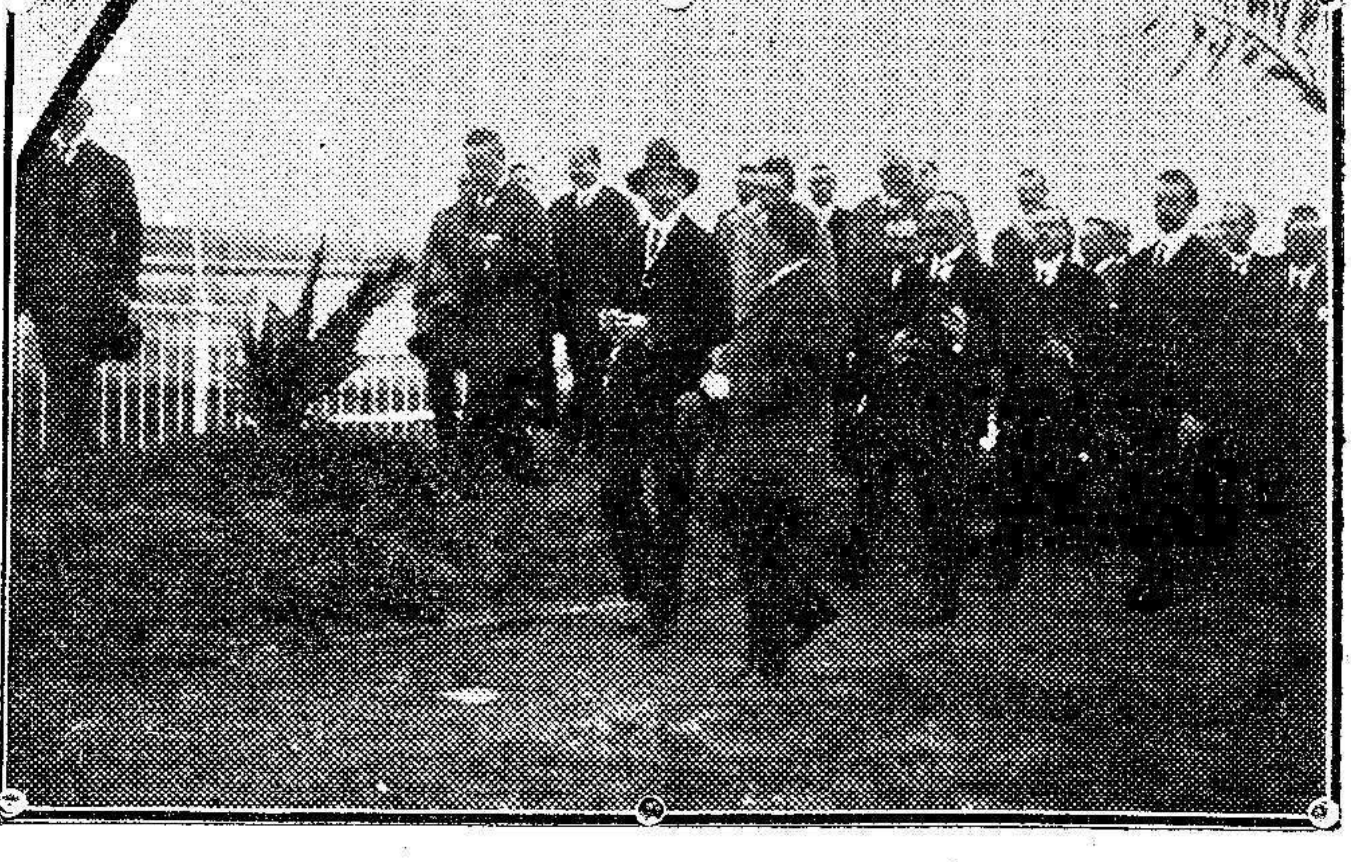
Su Majestad el Rey, acompañado del Presidente de la Sociedad del Tiro, de Sevilla, Sr. Camino, y de los socios de la misma, el día de la fiesta celebrada en su honor.