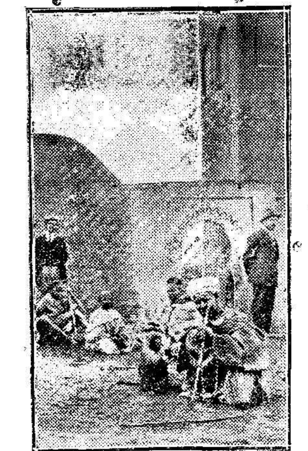
Larache.-Un rincón pintoresco.

Son las últimas horas de la tarde, cuan-