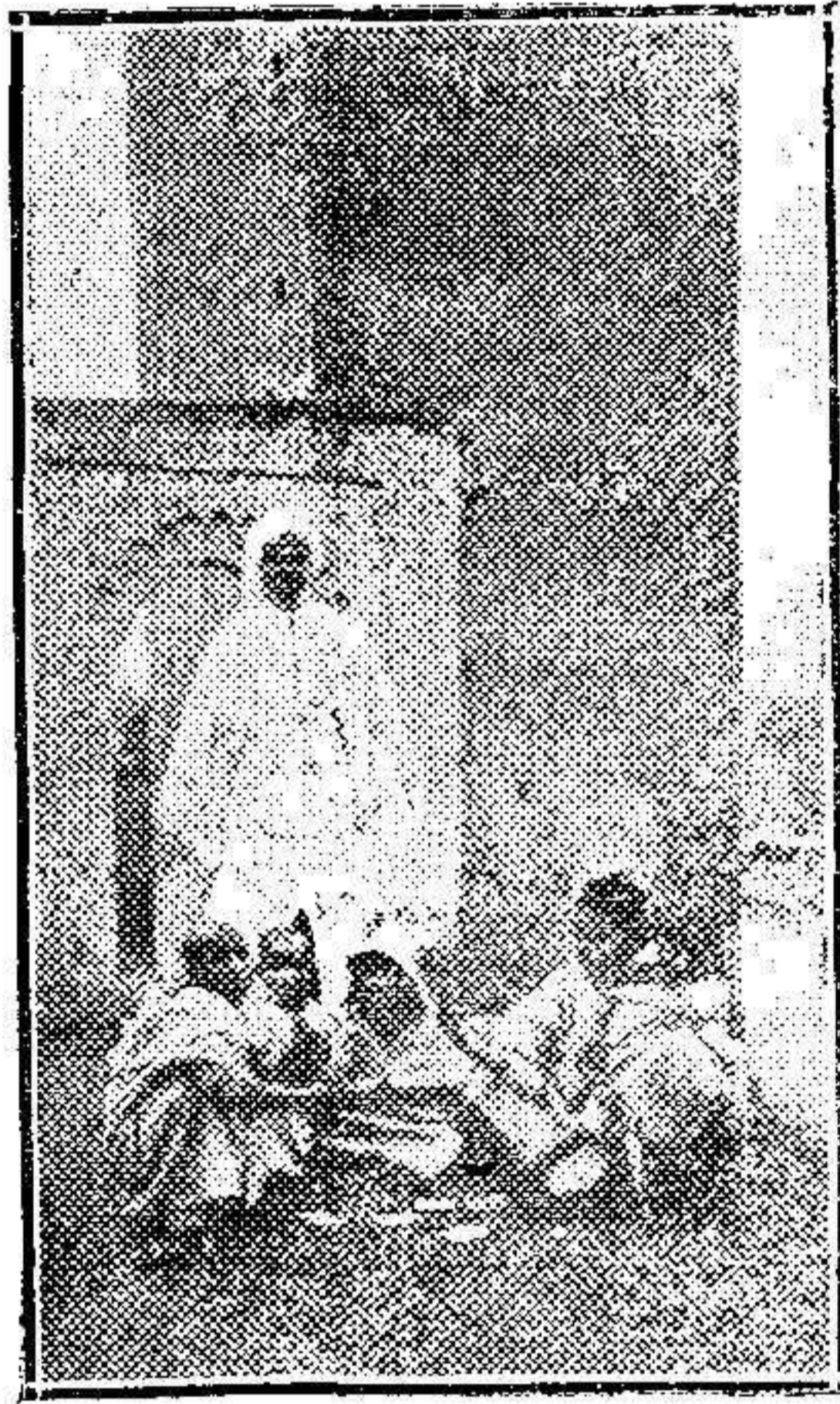
Moros de Alkazar jugando á las cartas.

La multiplicidad de él es será la salvación única del comercio de Larache.