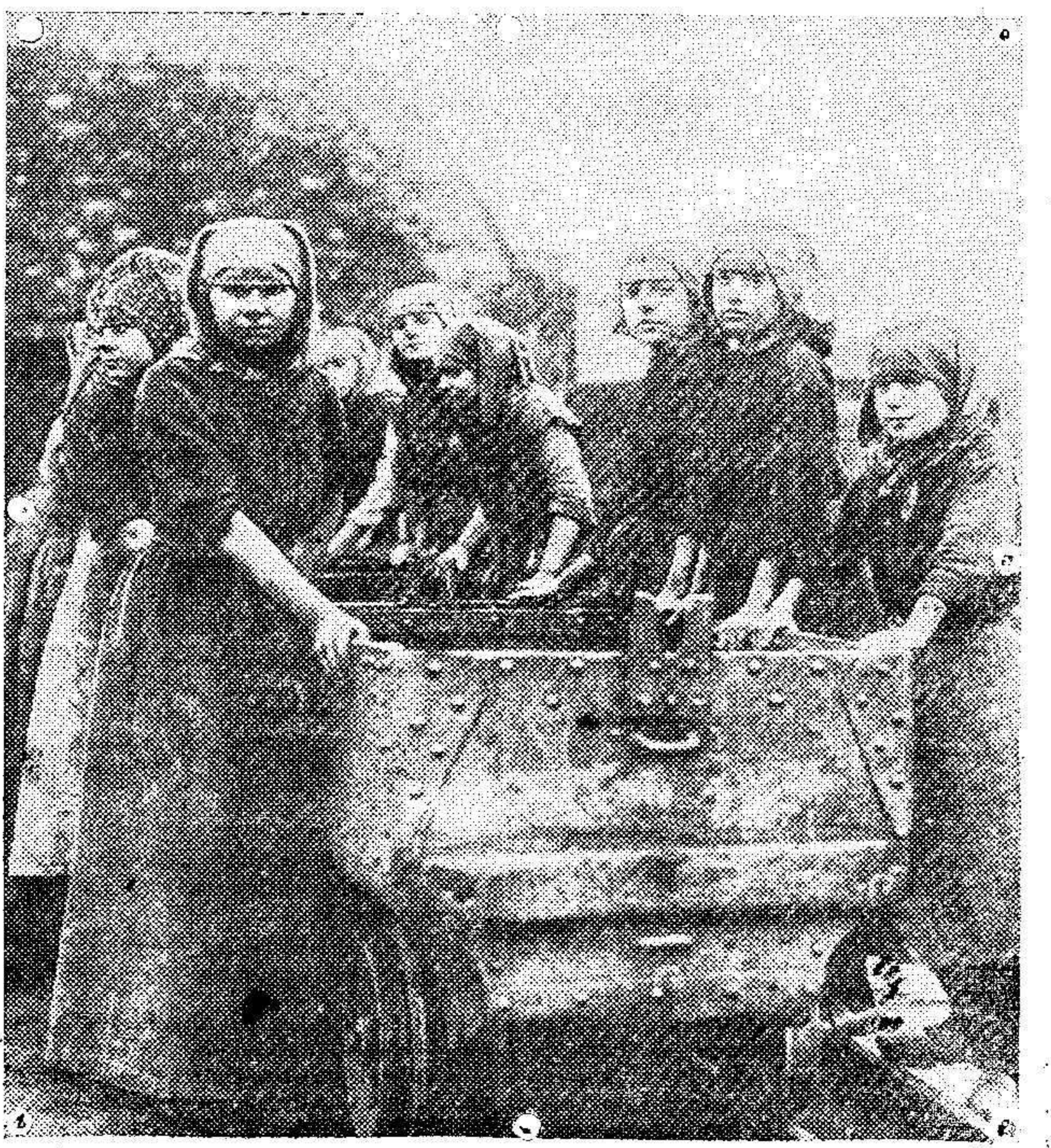
Mujeres belgas sustituyendo á los obreros en el trabajo de carga y descarga de carbón en Hennegan.

El cable Melilla-Almería dejó de funcionar el 23 de Septiembre de 1914.