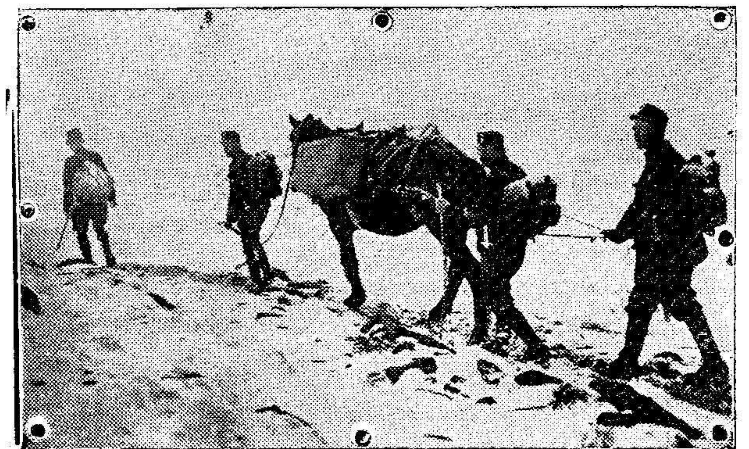
Una patrulla de gendarmes suizos de reconocimiento en la frontera de Francia.

Los trabajos comenzarán inmediatamente después de que se obtenga la correspondiente autorización.