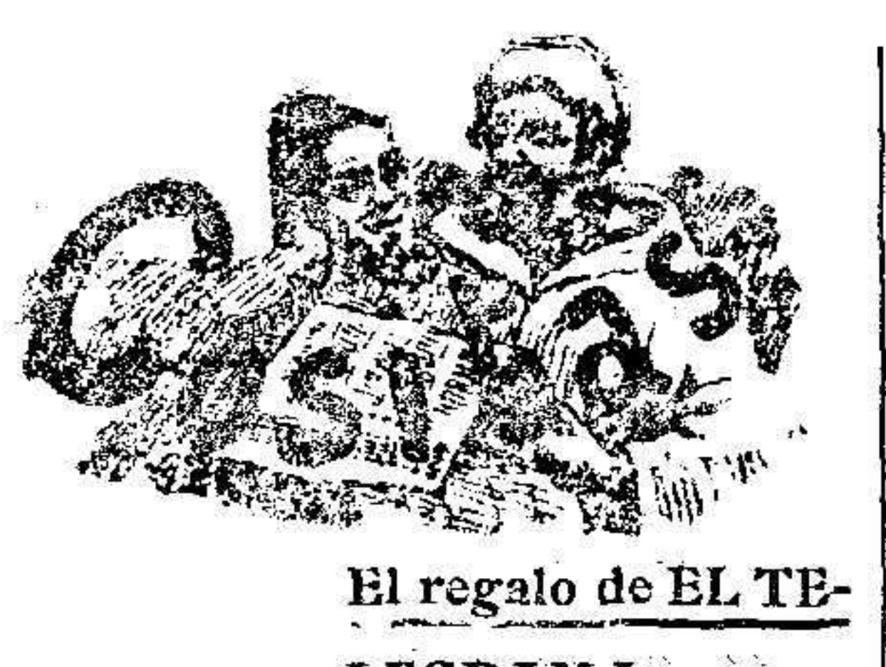
El regalo de EL TELEGRAMA

Con motivo de una inauguración En Madrid acaba de inaugurarse como saben nuestros lectores, una oficina especial para el Giro Postal, en la calle de Preciados.