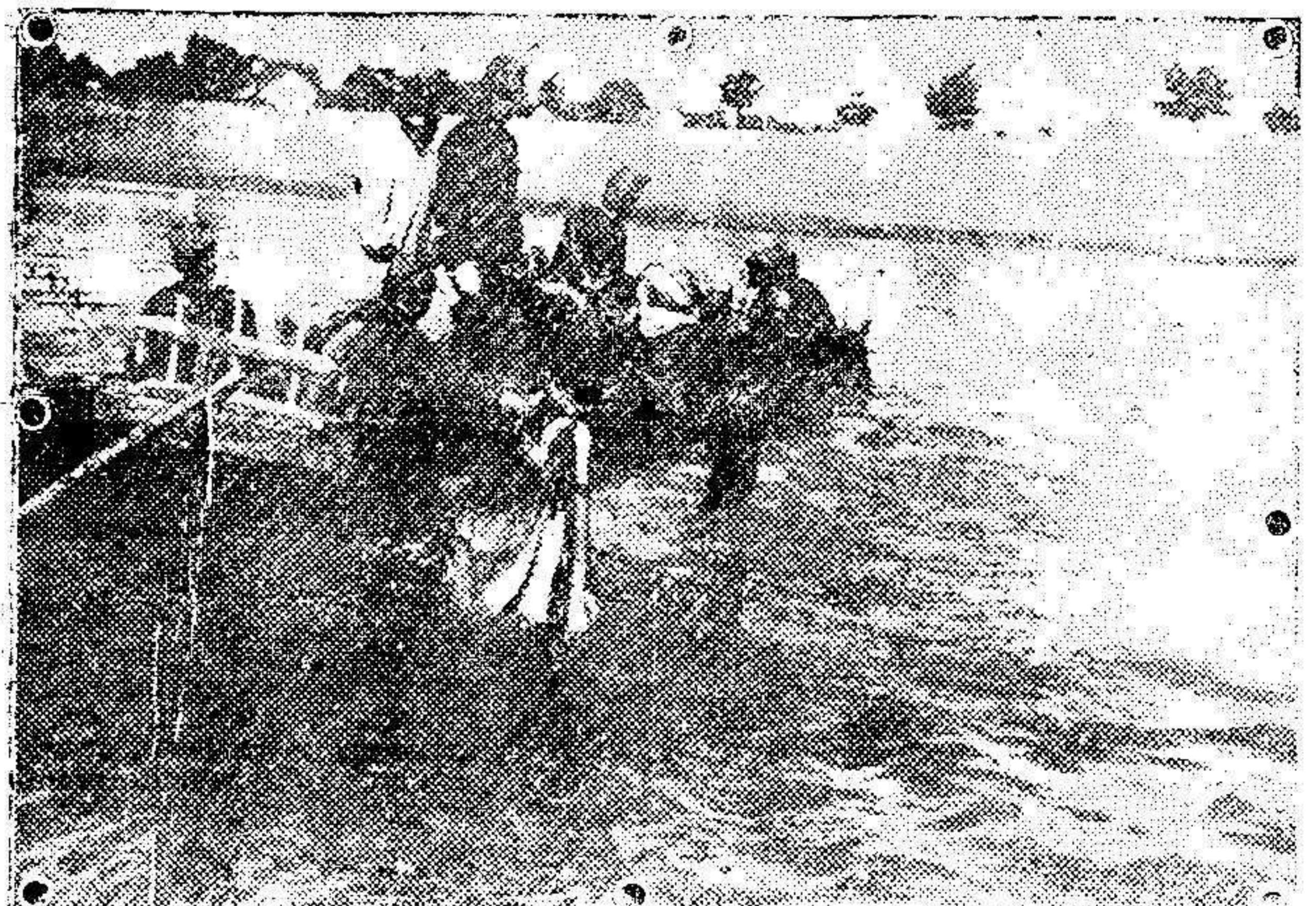
El Ejército austriaco. Una patrulla de húsares atravesando un río.