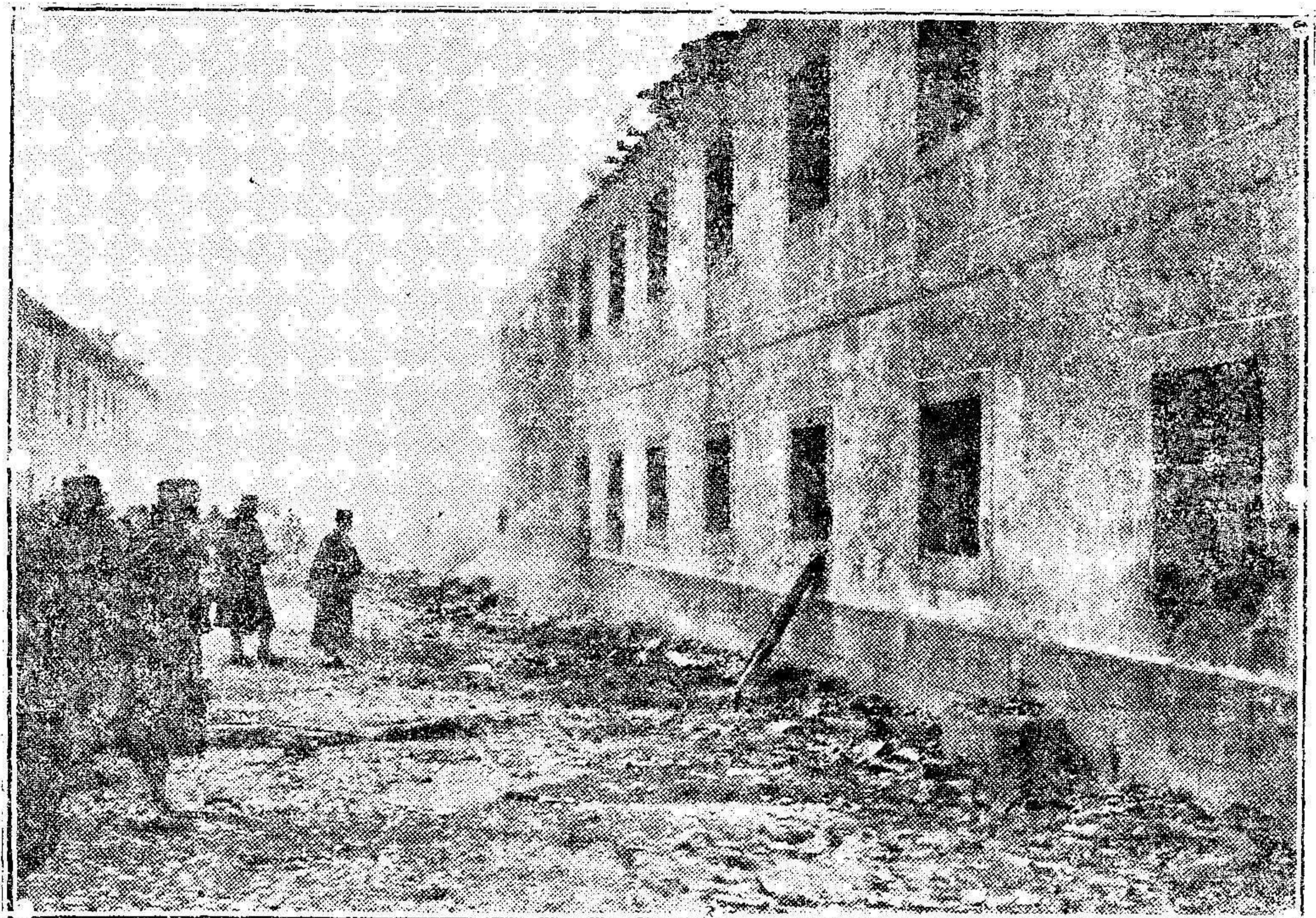
Aspecto de una de las naves que han sido destruidas por un incendio en el cuartel de Ingenieros de El Pardo.