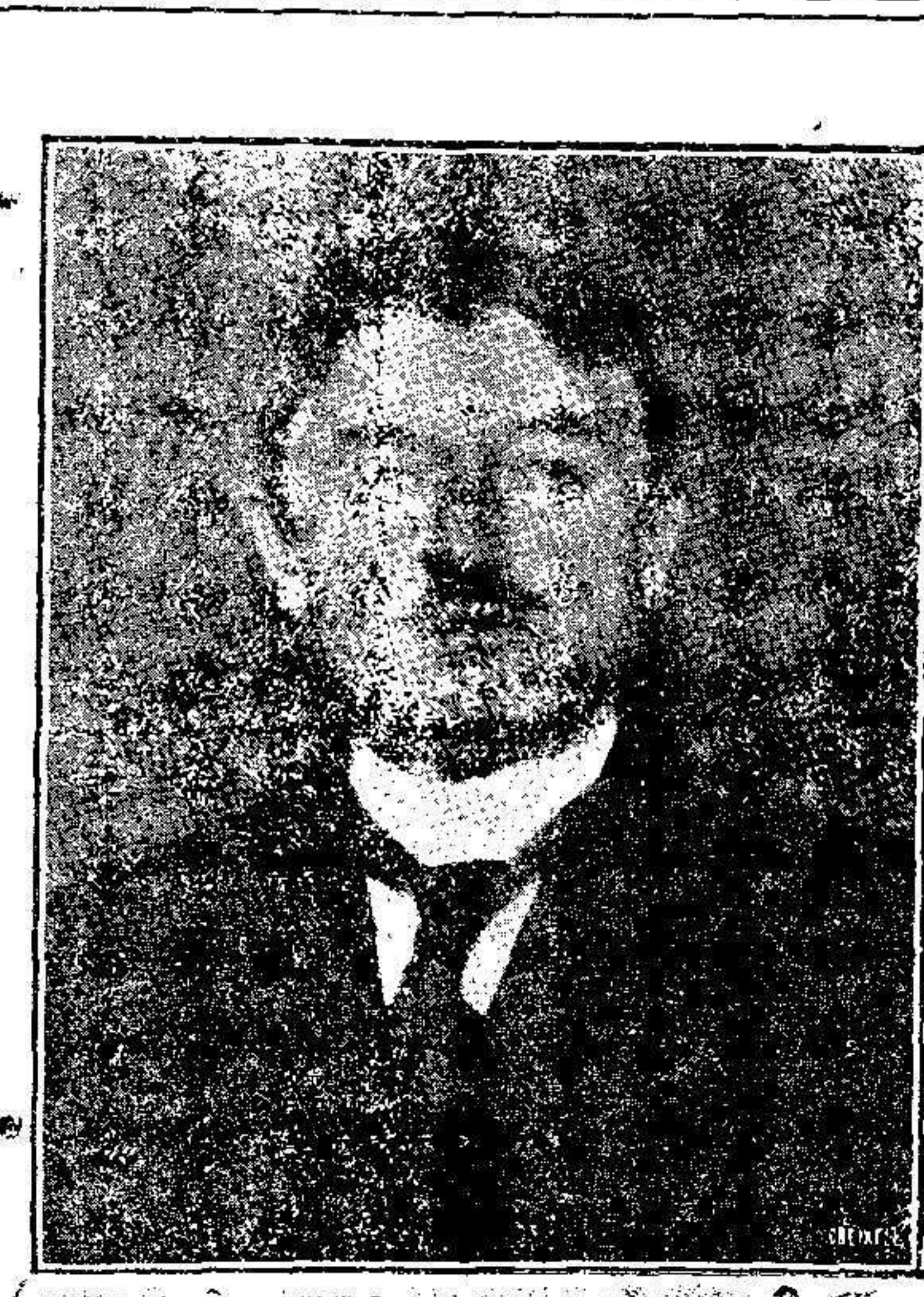
El súbdito alemán M. Mannesmann, que ha hecho al Gobierno austriaco proposiciones sobre la pacificación de Marruecos, rechazadas con indignación por el espíritu nacional.

«El Telegrama del Rif» se halla de venta hasta las diez de la noche en el KIOSCO NACIONAL de la Plaza de España.