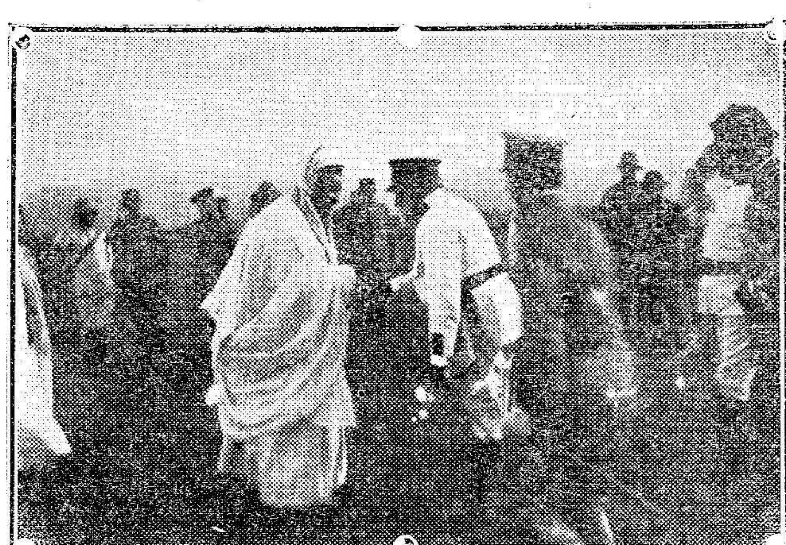
El General Merina en Tetuán en el momento de saludar á S. A. el jalifa

Varias balas han penetrado, en efecto, en las viviendas, causando desperfectos en los muebles, y en la batería de la Corona han sibilado al pasar por las antiguas cañoneras colándose por entre los sacos terceros que las cubren. Por fortuna, las obras de defensa son acertadamente llevadas á cabo por los ingenieros y los demás soldados de la guarnición que al efecto se destinan, y rápidamente adelanta la construcción de sólidos espaldones, pues los primeros, por la urgencia del momento, solo fueron provisionales.