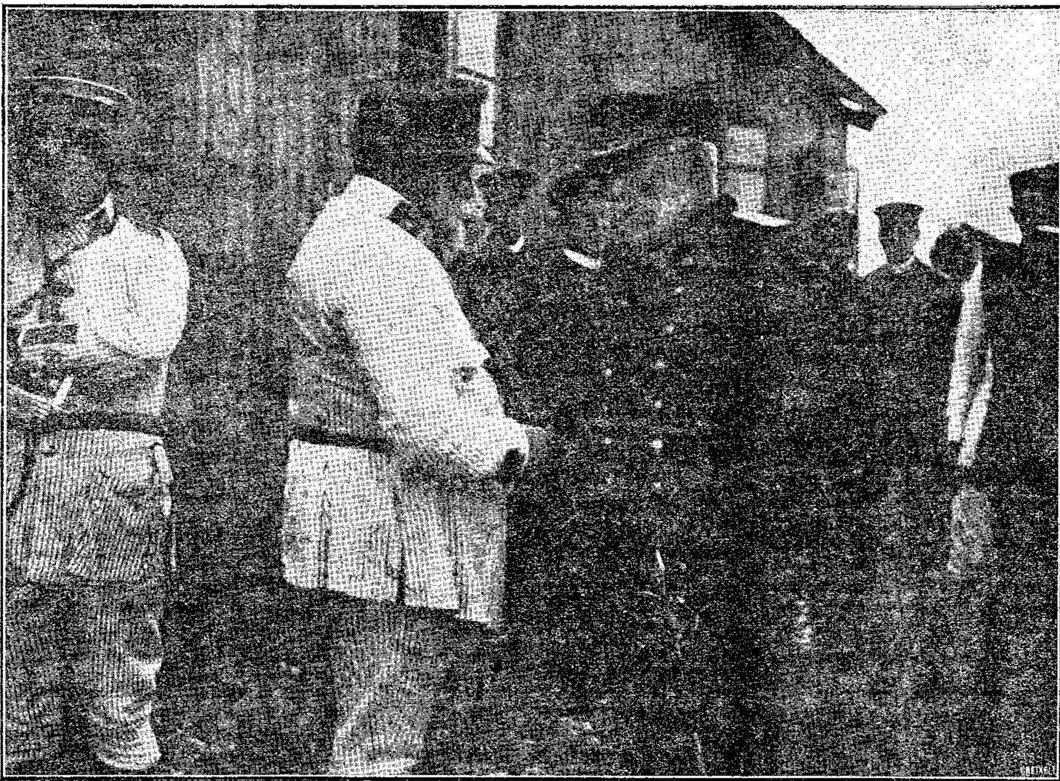
El General Marina y el Comandante General de nuestra escuadra

En el peñón de Alhucemas no ocurre novedad alguna, y según nuestros informes, pronto cesará la actitud en que se ha colocado la gente del campo, que forzadamente ansiará la apertura del mercado pues han de sentir escasez de los