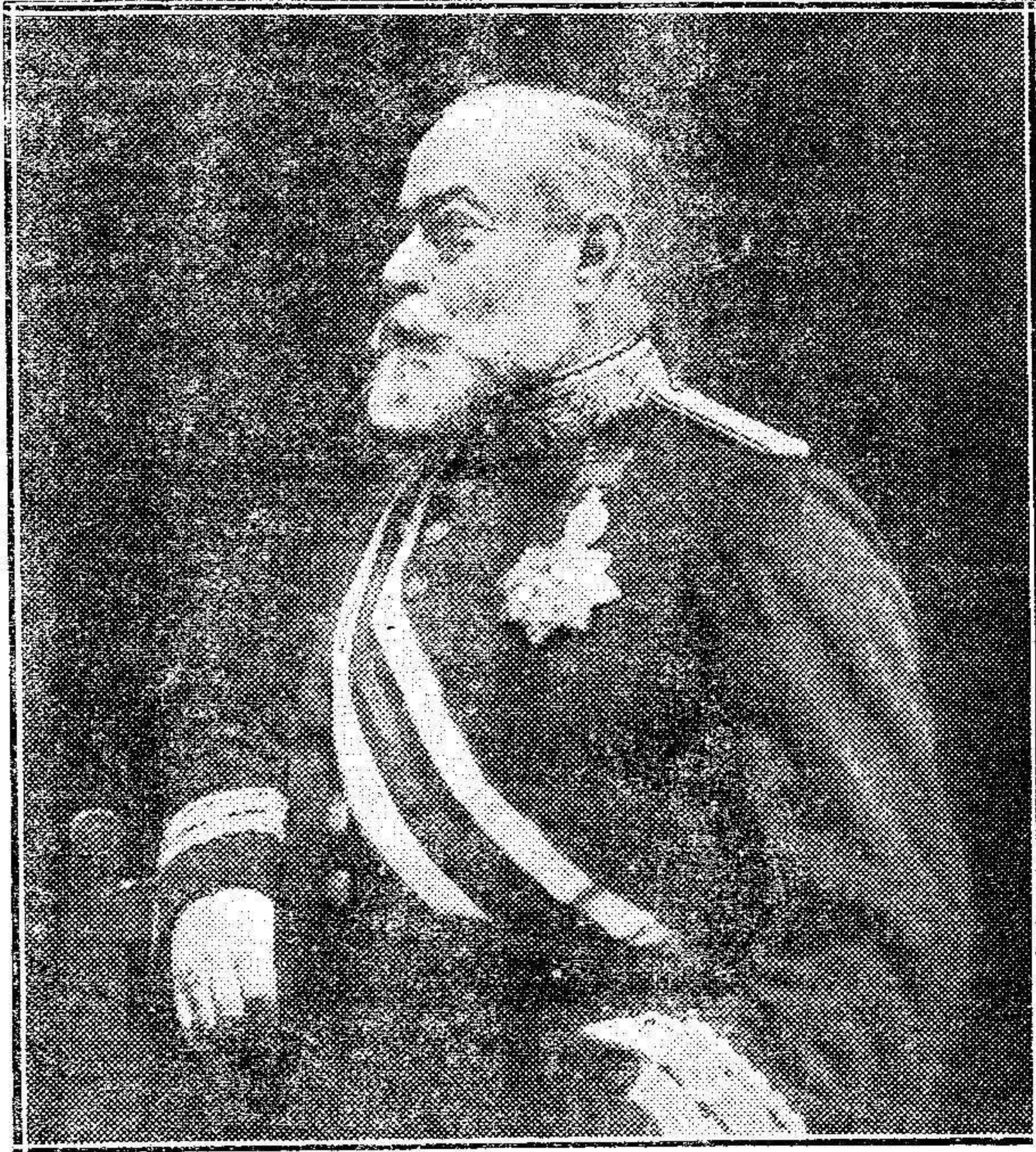
El Alto Comisario de España en Marruecos Excmo. Sr. Teniente General Don José Marina Vega.