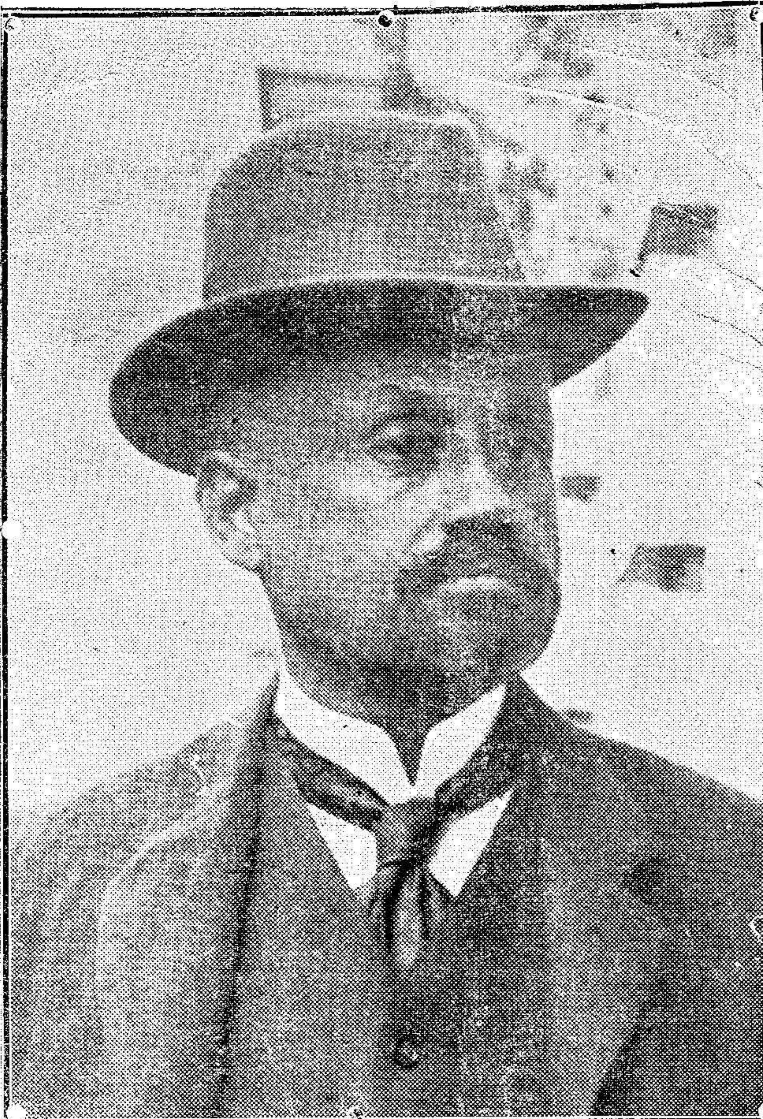
El famoso general Cipriano Castro, cuya llegada á Venezuela ha dado motivo á sus partidarios para declararse en rebelión contra el Gobierno.

(1) Aquí cité el nombre de otra persona. (2) El mismo nombre.