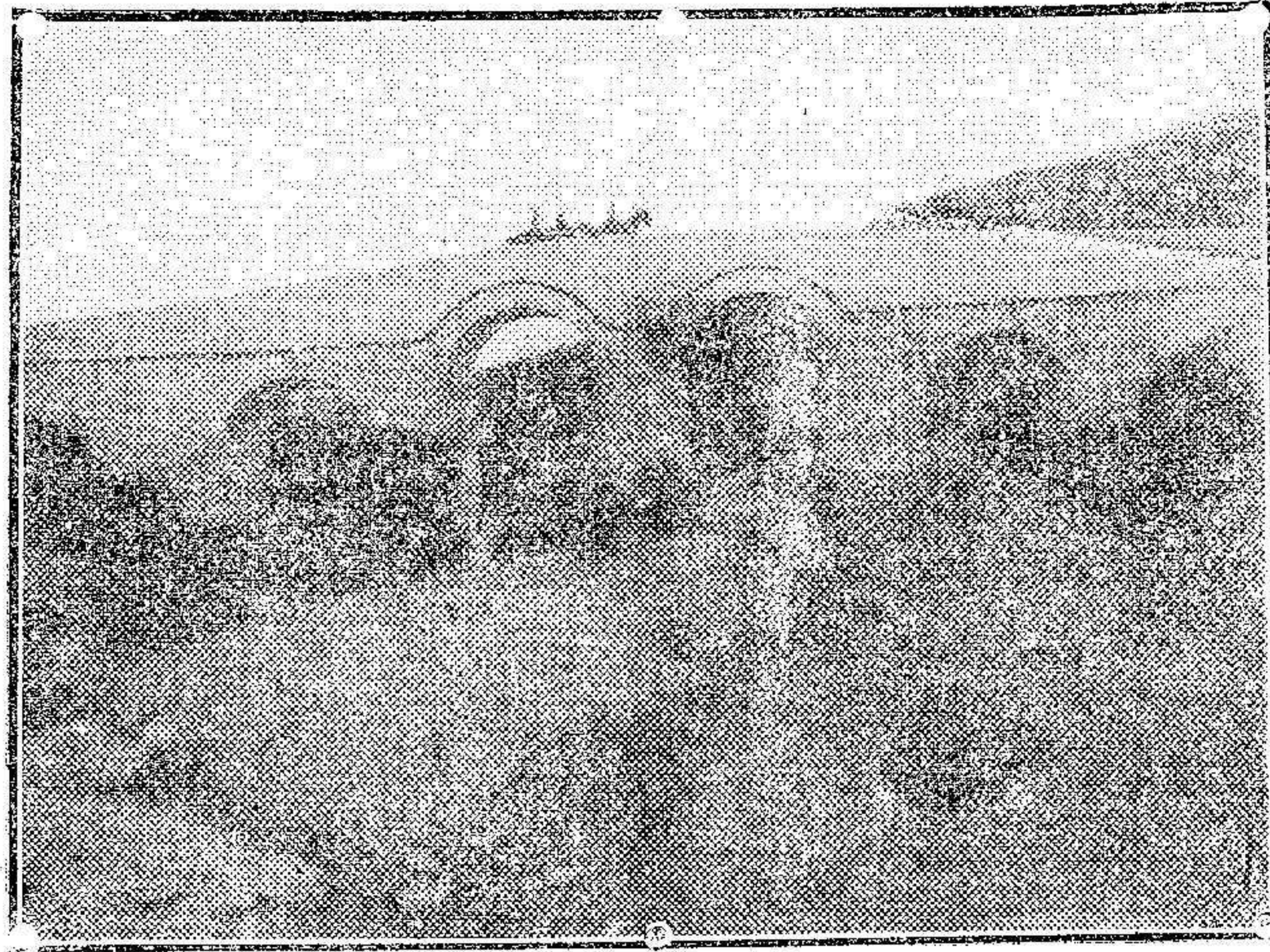
Vista del célebre puente de Buceja.