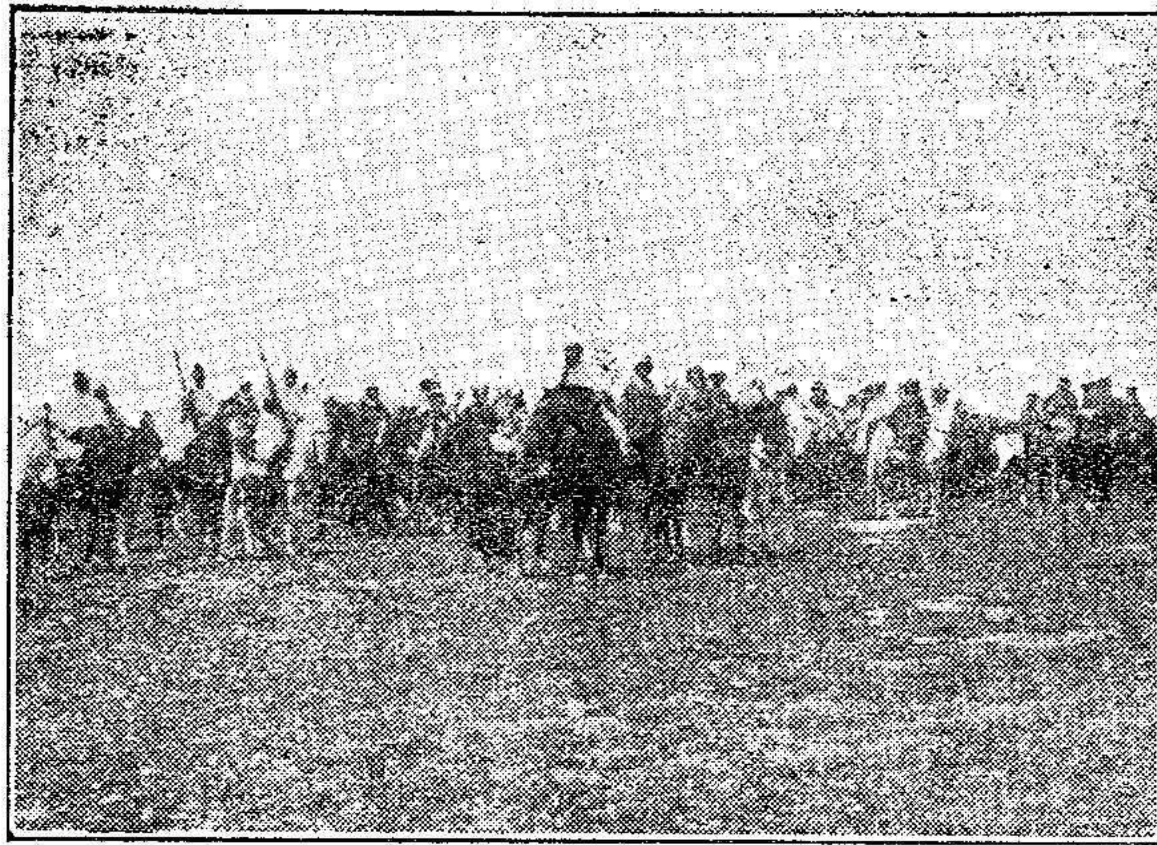
Los «chiu» de Guelala, Quebdana y Uad Soffut, que dieron escolta al General Jordana.