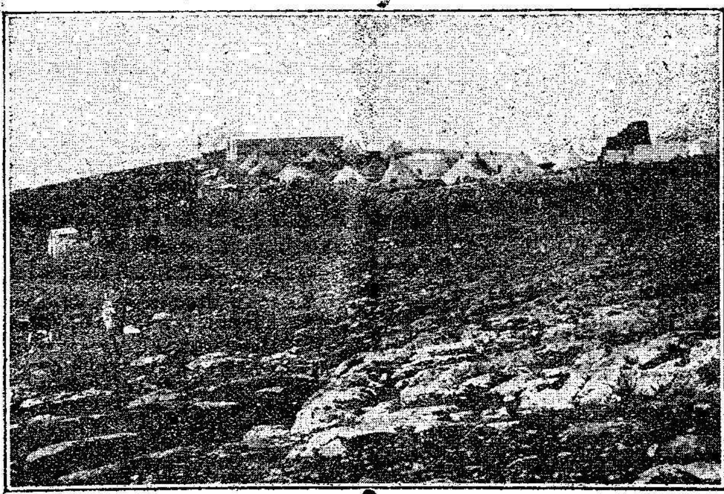
El campamento del Harcha