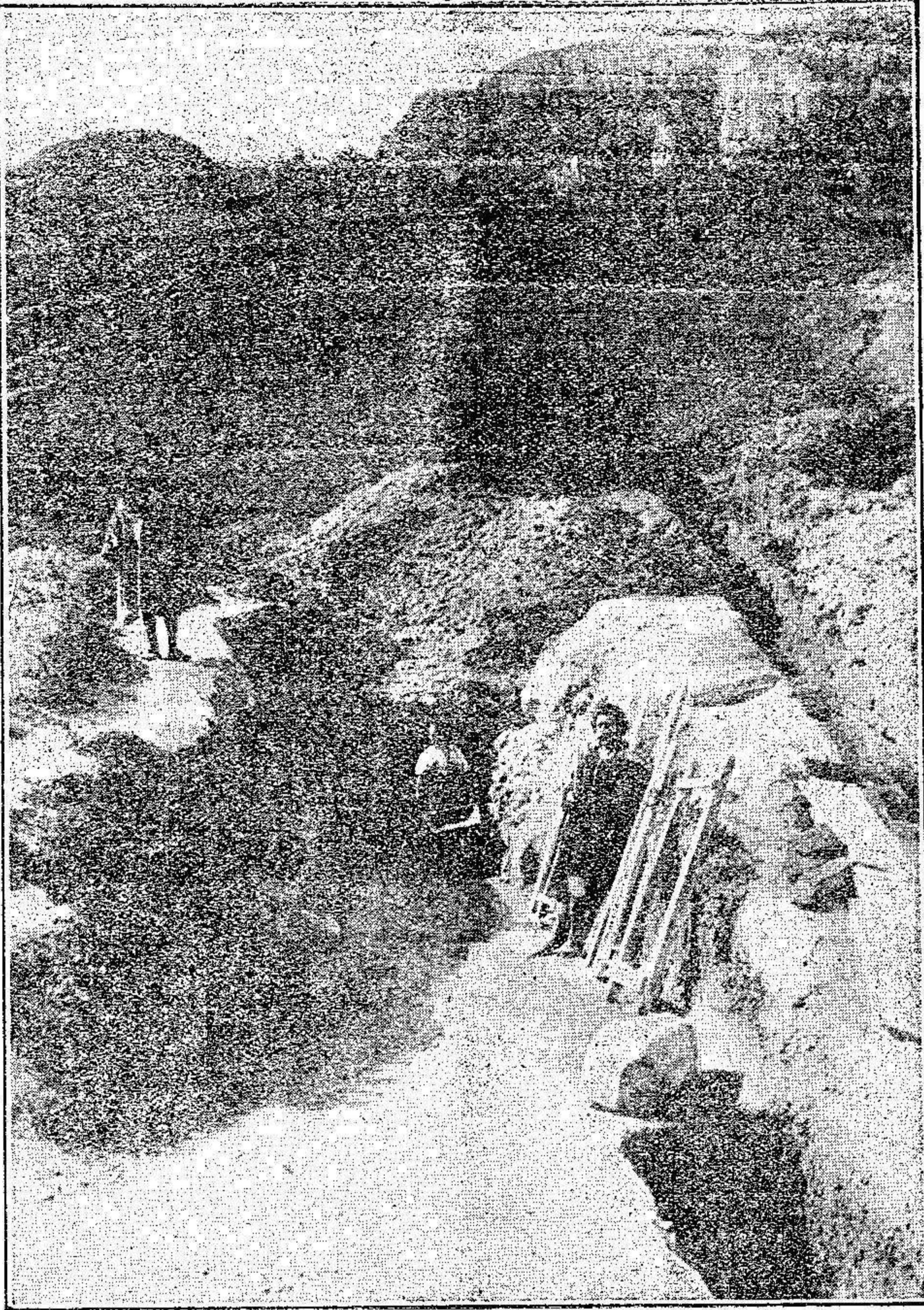
Indígenas trabajando en una mina de Beni-bu-Ifrur