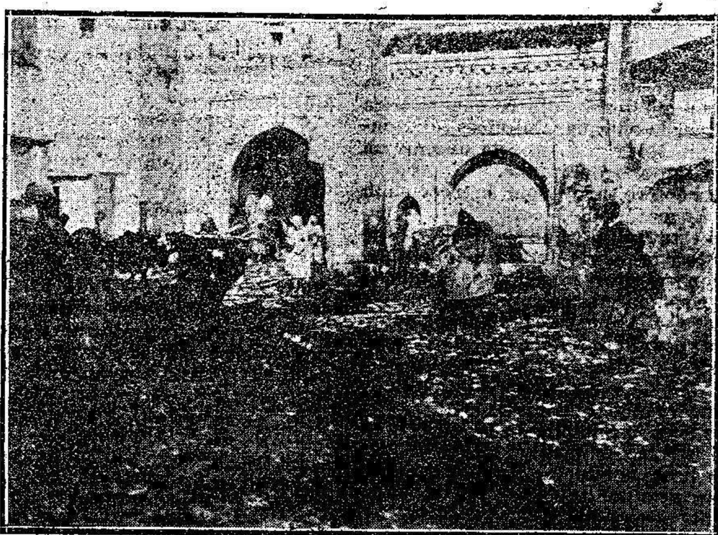
TETUÁN.—Interior de la puerta llamada de Tánger.