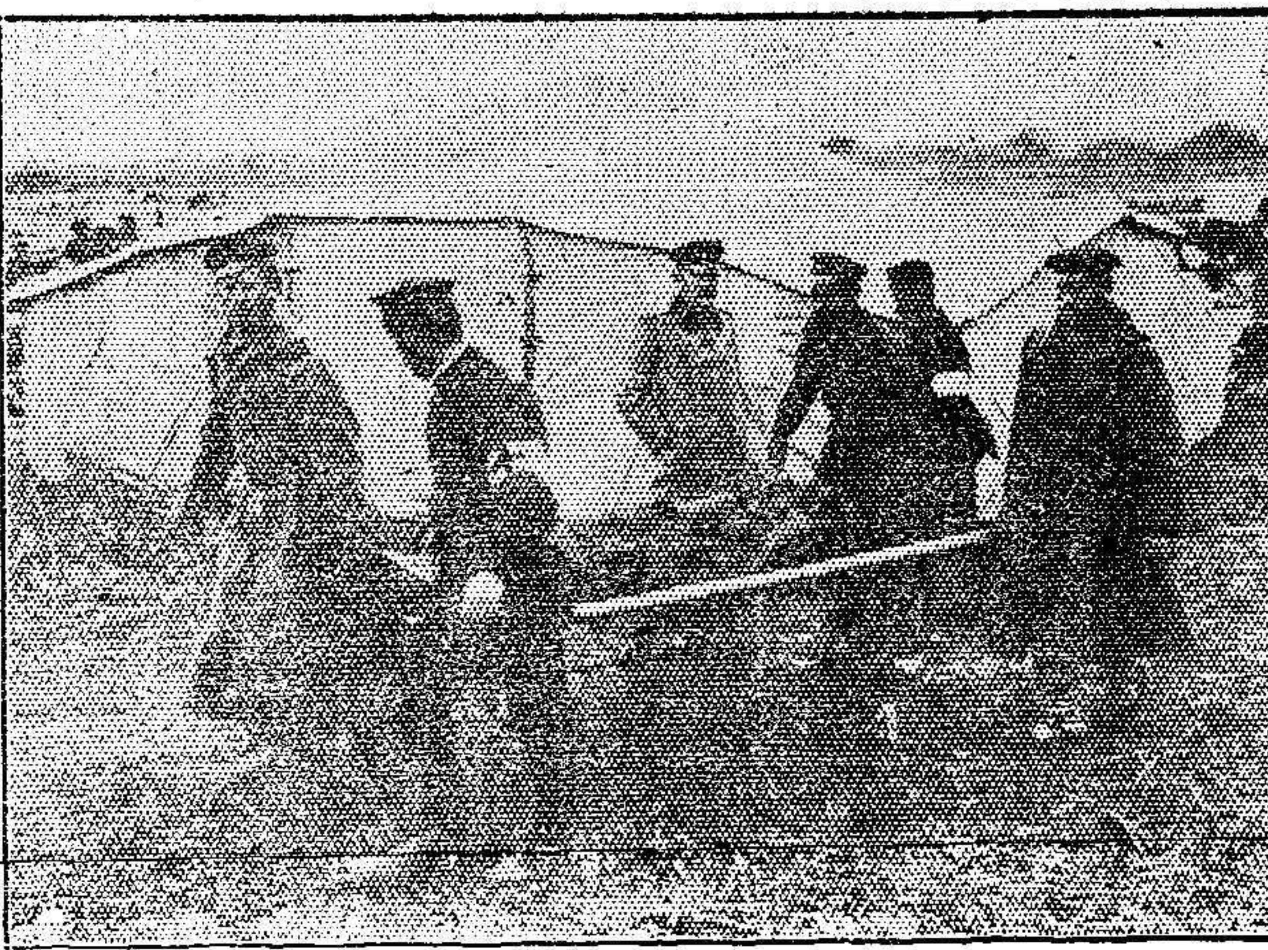
Hospital ambulante en los alrededores de Andriápolis