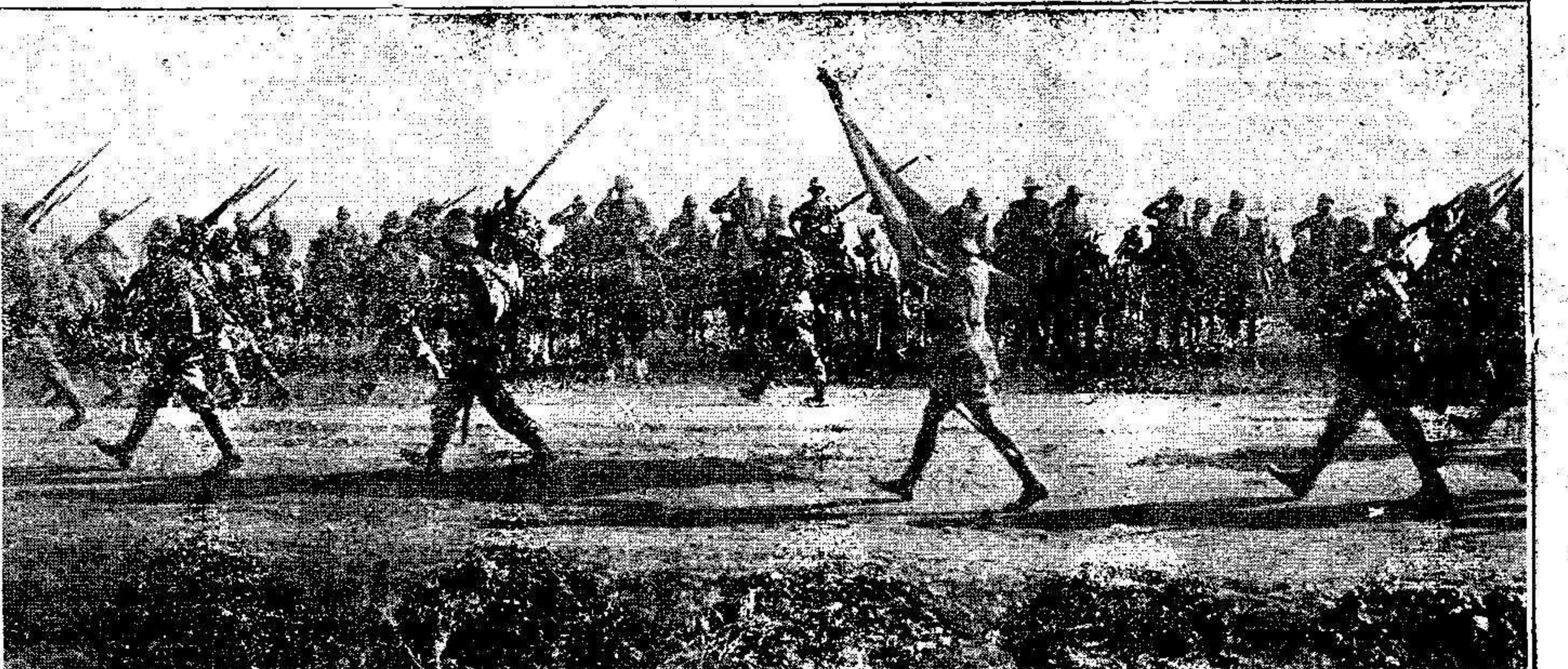
SEGUNDA CASETA.—El desfile de las tropas ante el Capitán General (X) después de la misa de campaña.