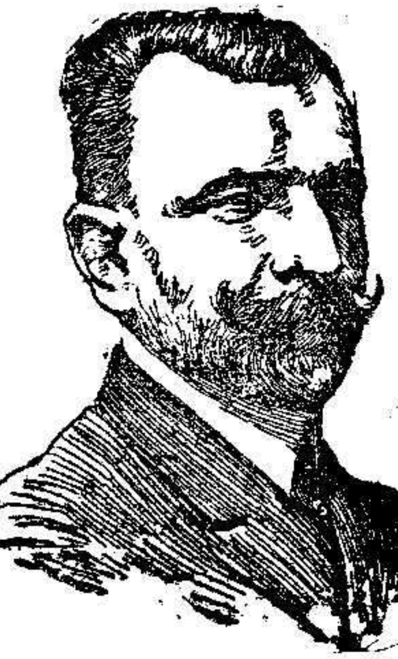
D. Amalio Gimeno Nuevo Ministro de Instrucción Pública