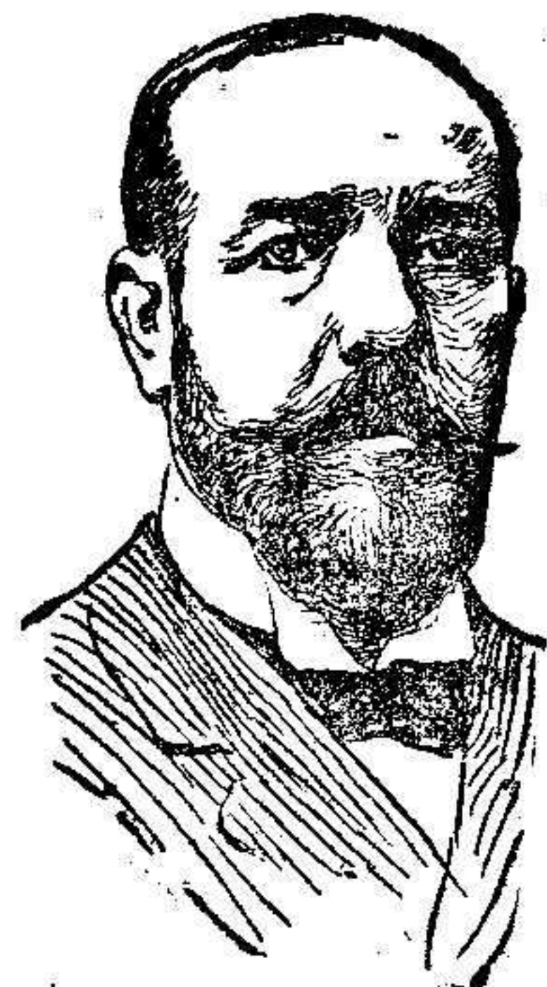
D. Tirso Rodríguez Nuevo Ministro de Hacienda