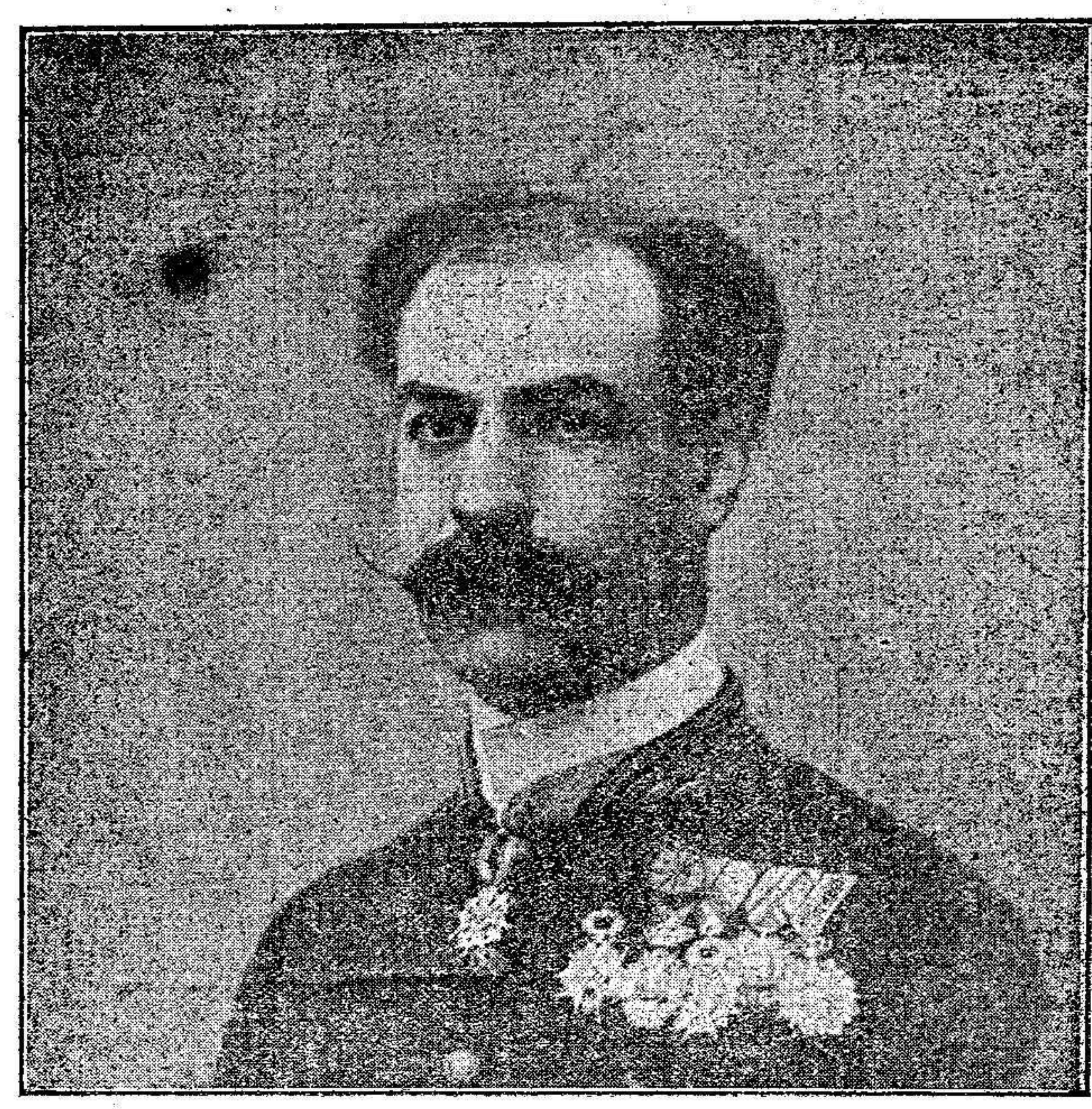
Excmo. Sr. Don Alfonso Merry del Val

AÑO X Redacción y Administración: Iglesia, 4 MELILLA.—Jueves 12 de Enero de 1911 Imprenta y Encuadernación: Iglesia 2 NÚMERO 2716