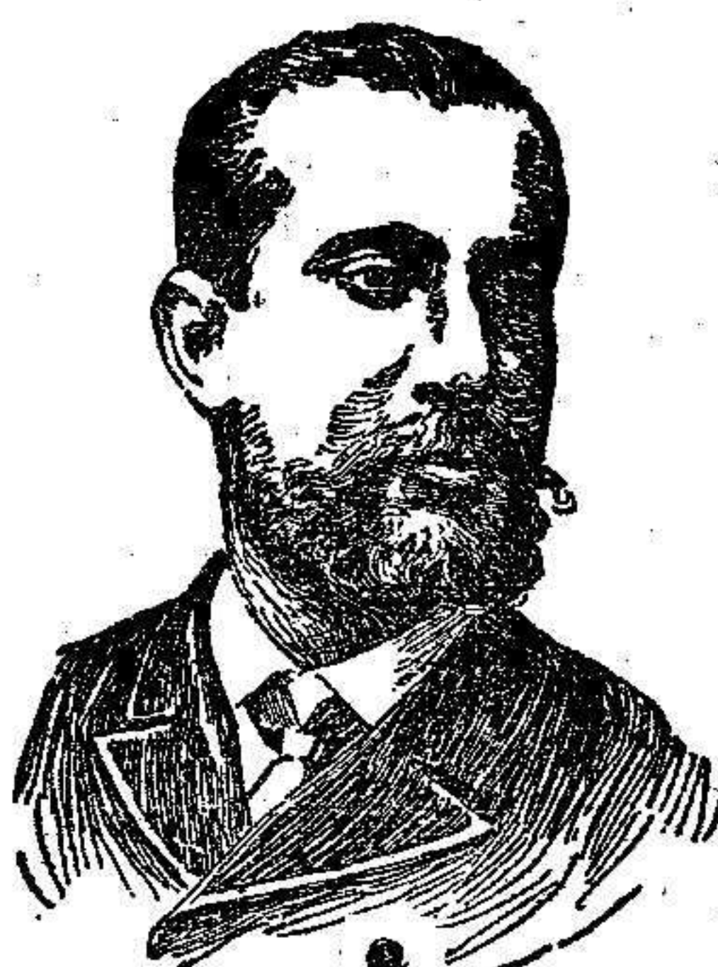
El Príncipe Alberto de Mónaco

París . . . . . 750 Londres . . . . . 27'40