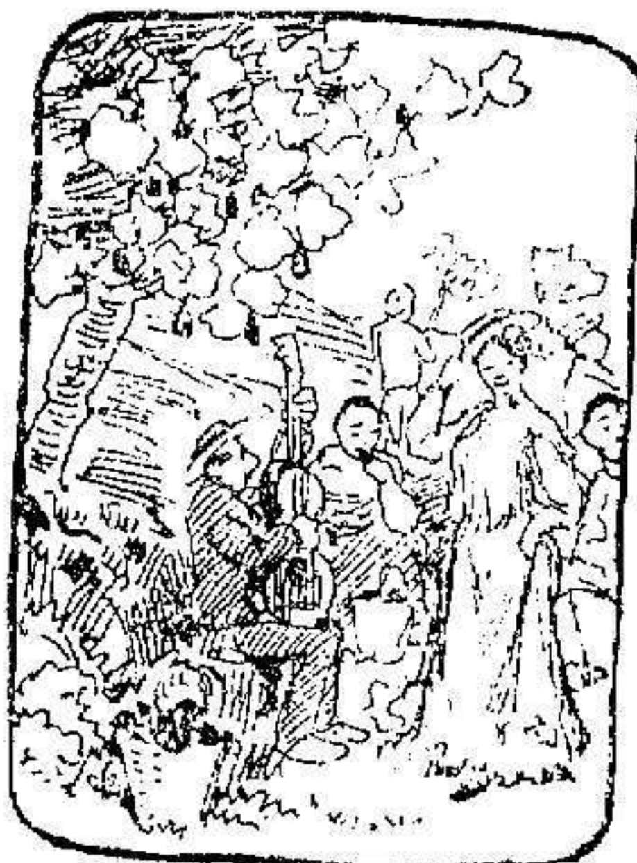
Lo que priva hoy en Melilla