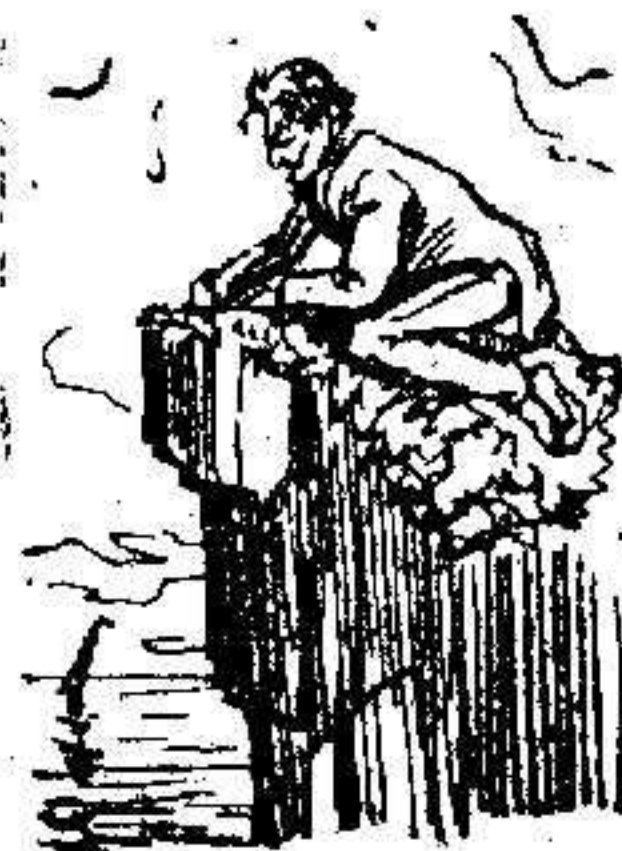
Viendo pescar desde el reflector.

Si señor, la pesca con caña proporciona á los iniciados delicias inefables.