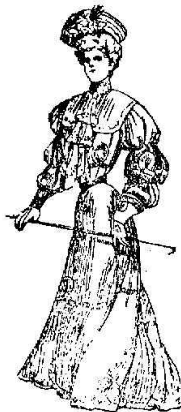
Traje para paseo y visita, de tela fantástica, rameada.

El delantero, liso, no ofrece nada de particular, y si la espalda del cuerpo torera, rcamada de blondas, así como la falda, cuyos volantes son bastante vistosos.