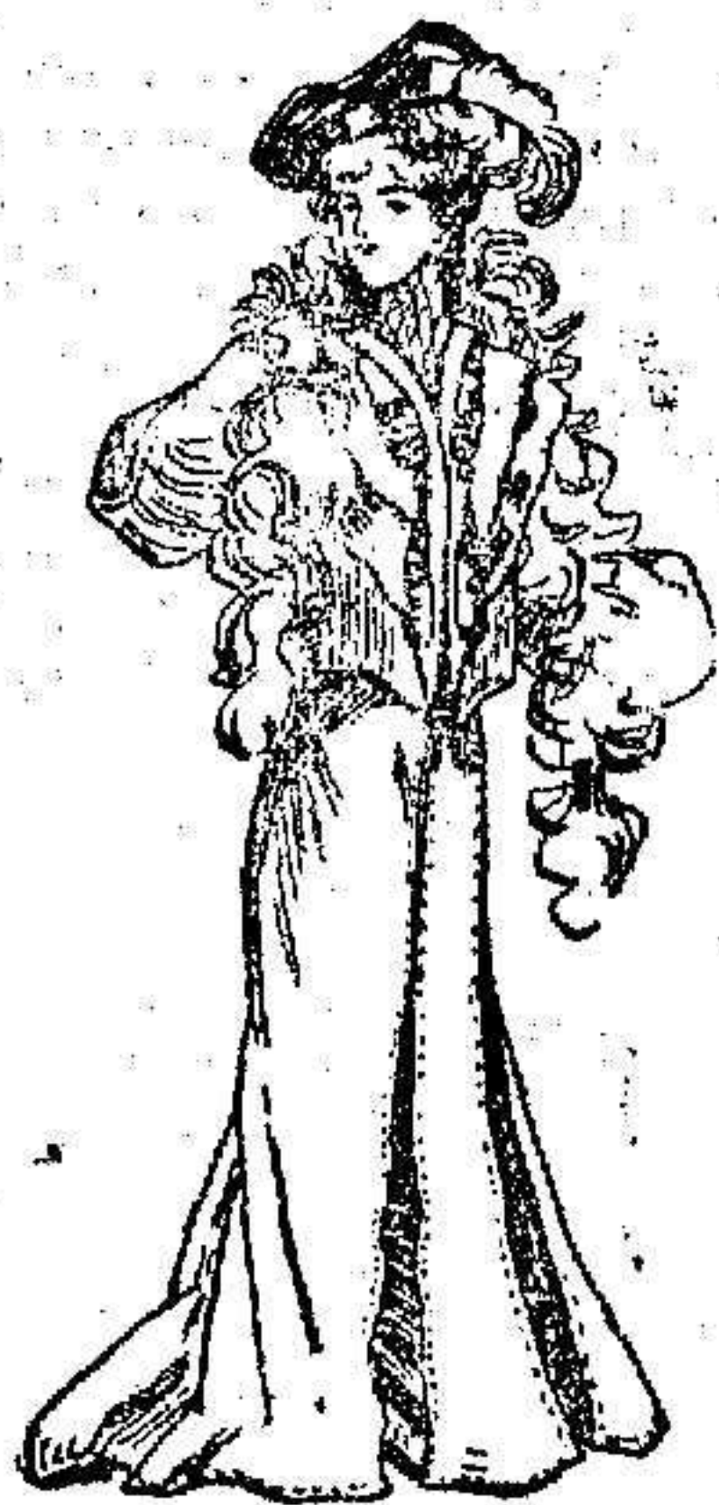
Trage para paseo

De paño color verde Nilo. Falda bastante larga con ancho pliegue en el delantero, y éste abierto sobre un fondo de terciopelo negro. El cuerpo en forma de paletó corto, con doble cuello de la misma tela, adornado con terciopelo y colgantes de pasamanería. Manga abierta á lo largo sobre el terciopelo.