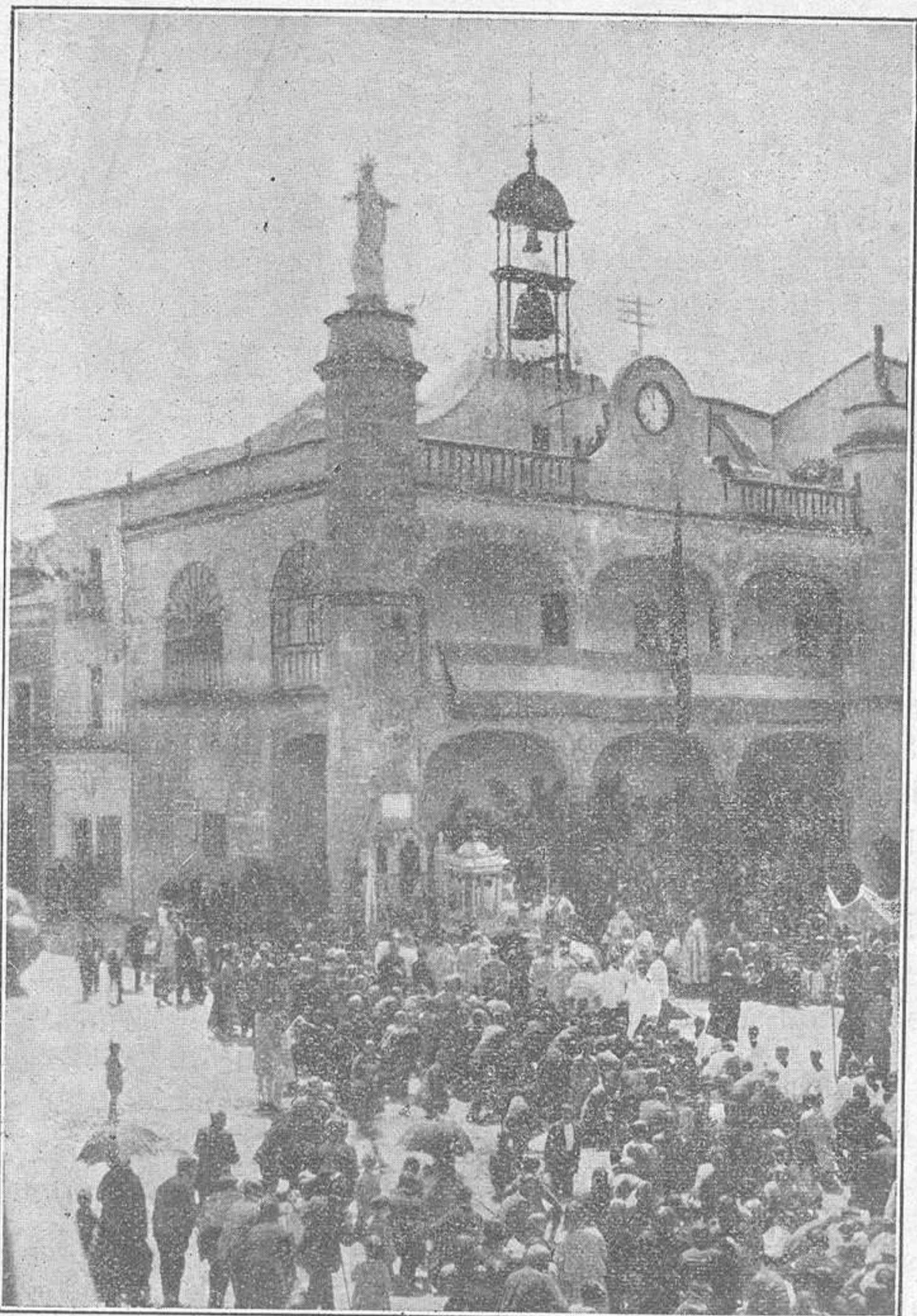
El Corazón de Jesús entronizado en el Ayuntamiento de esta Ciudad.

Ellos dicen: «Tenemos dioses de sobra, el trabajo, las máquinas, el dinero, el odio de clases... Ya no queremos más esas divinidades. Queremos un Dios que nos ame...»