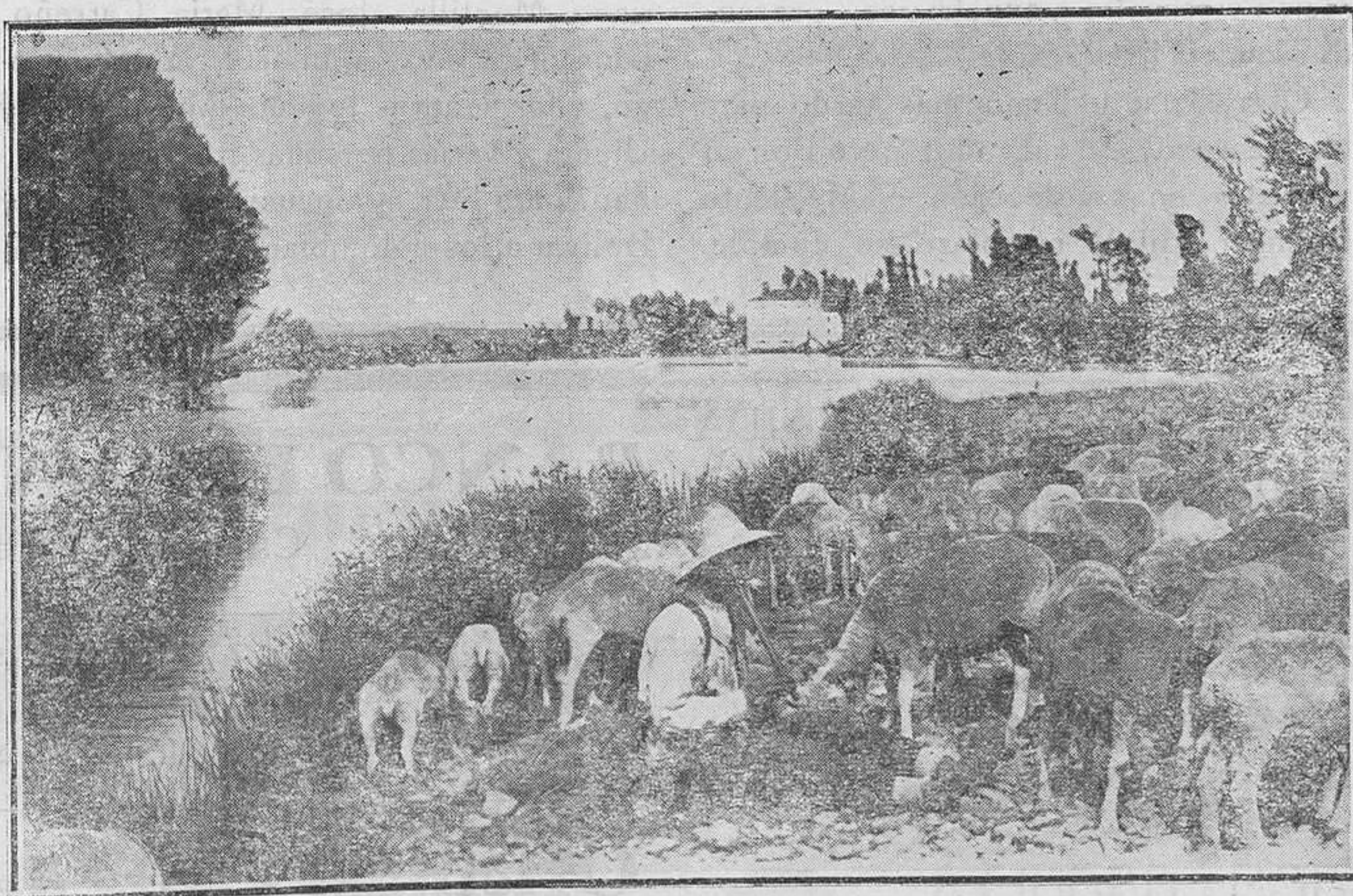
Ciudad Rodrigo.—A orillas del Agueda

Otro medio propuesto es la efectividad y anticipación del retiro obrero. Deben los hombres tener un tiempo al menos de descanso en la vida cuando comienzan a debilitarse sus fuerzas; ni es menester esperar a un agotamiento absoluto, tanto más cuanto que con este anticipado descanso se favorece a las nuevas generaciones que se levantan para ocupar las plazas de las que están en el ocaso.