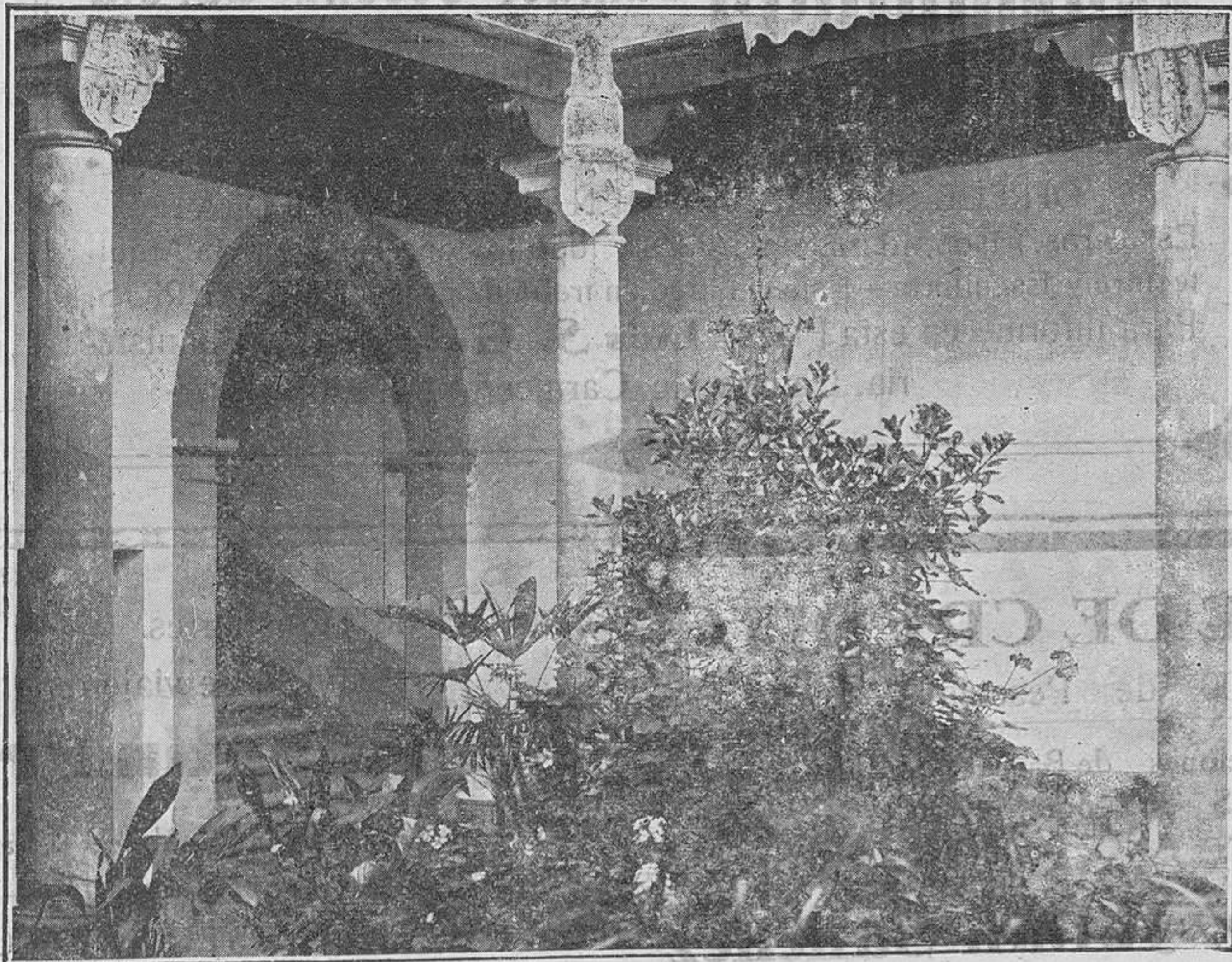
Ciudad Rodrigo.—Patio de una casa solariega.