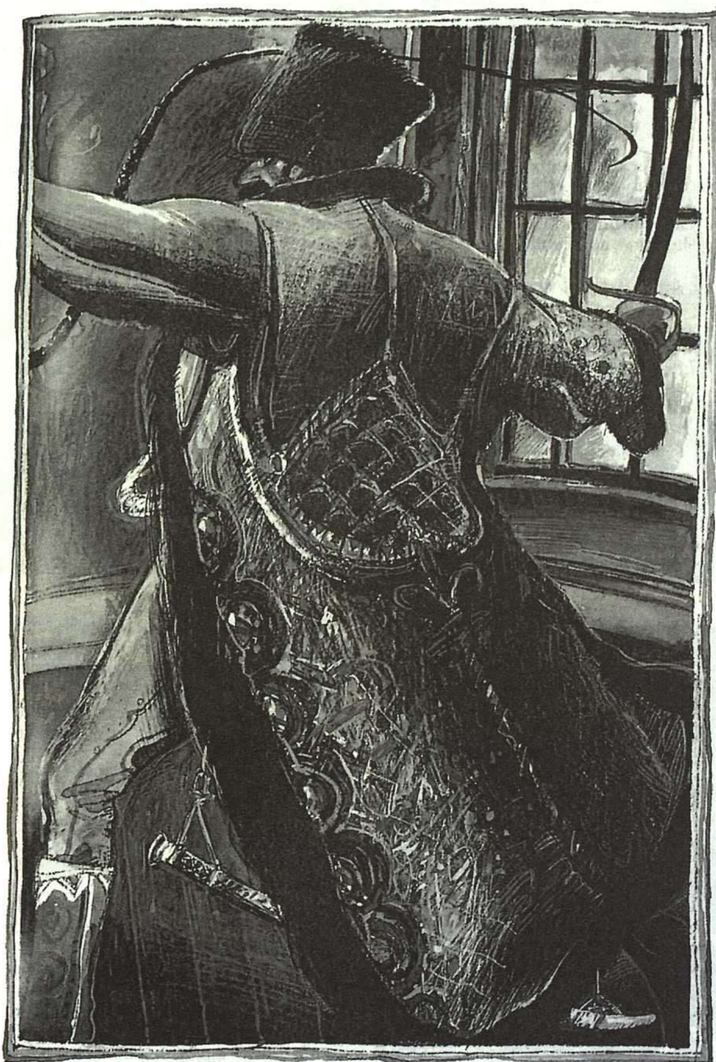
JAVIER SERRANO, MIGUEL STROGOFF, MADRID: SM, 1986.

la Llingua Asturiana, 1992. (Edición en asturiano.) De la Terra a la Lluna , Barcelona: Barcanova, 1992. (Edición en catalán.)