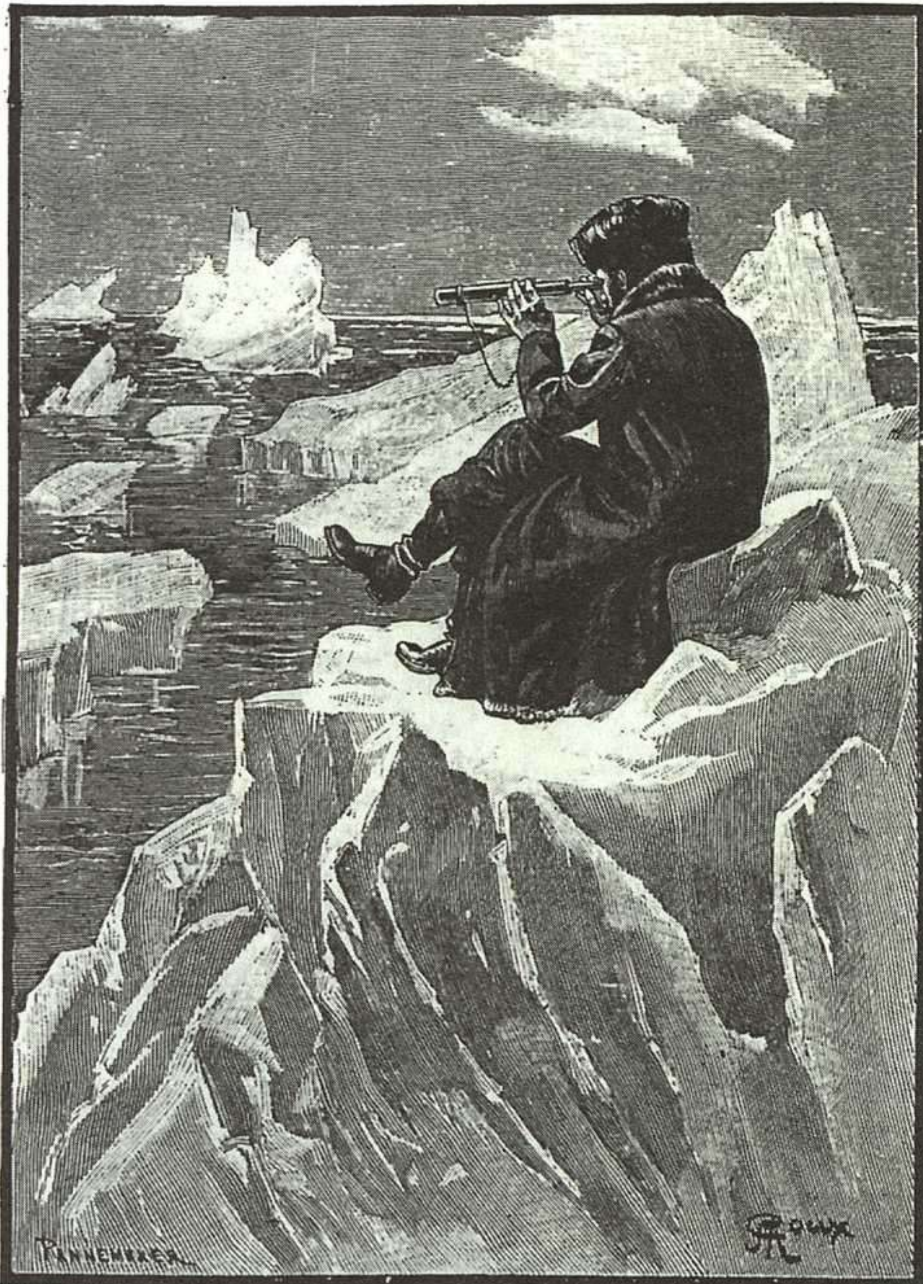
G. ROUX, LA ESFINGE DE LOS HIELOS, MADRID: ANAYA, 1992.