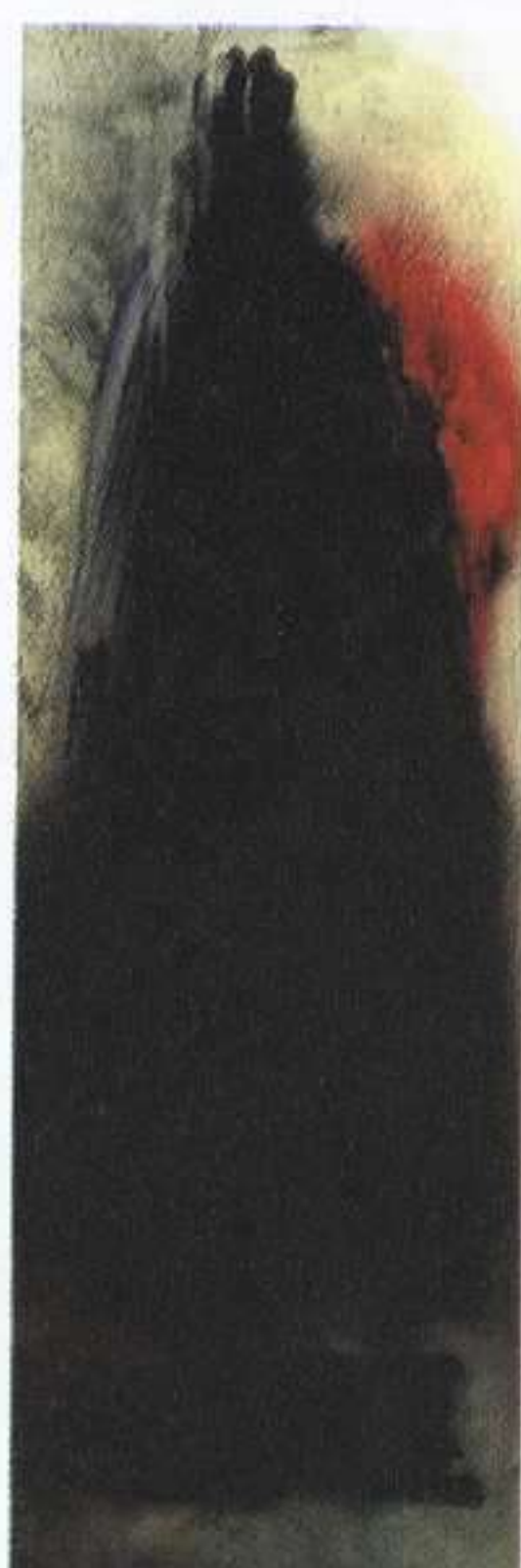
Tres cuadros, 1995